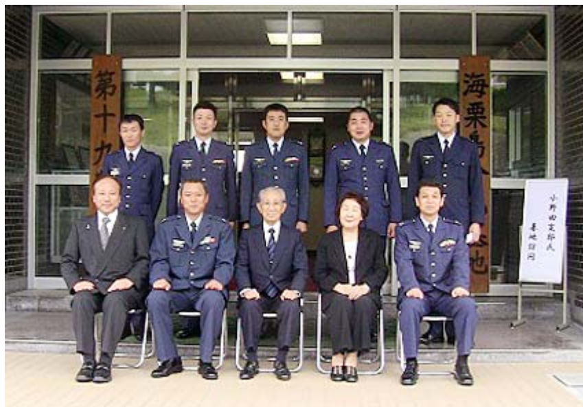
航空自衛隊・対馬第19警戒隊の方々と記念撮影(5月26日)

私は約2年前にも此の地を訪れていますが、今回新たな知識として、此の海上自衛隊・対馬防備隊施設の隣「対馬リゾート」の他に、水上機停泊、格納施設横に位置します「フィッシング・リゾート・シーズン」など合計3件の韓国資本の施設が存在する事を知りました。