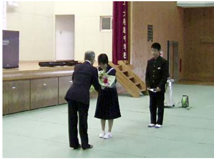
小野田自然塾として実施した対馬大船越中学校での 講演後に花束贈呈を受ける(5月25日)

此の竹敷駐屯地隣に韓国経営の「対馬リゾート」があり、またこの敷地内には、平成2年の天皇、皇后両陛下「行幸記念の碑」があります。今回海上自衛隊・対馬防備隊の方々と訪問しました。この敷地内には旧帝国海軍の赤レンガ造りの弾薬庫がそのまま残されている他、海に面した岸壁は当時の水雷艇基地の姿が残っています。