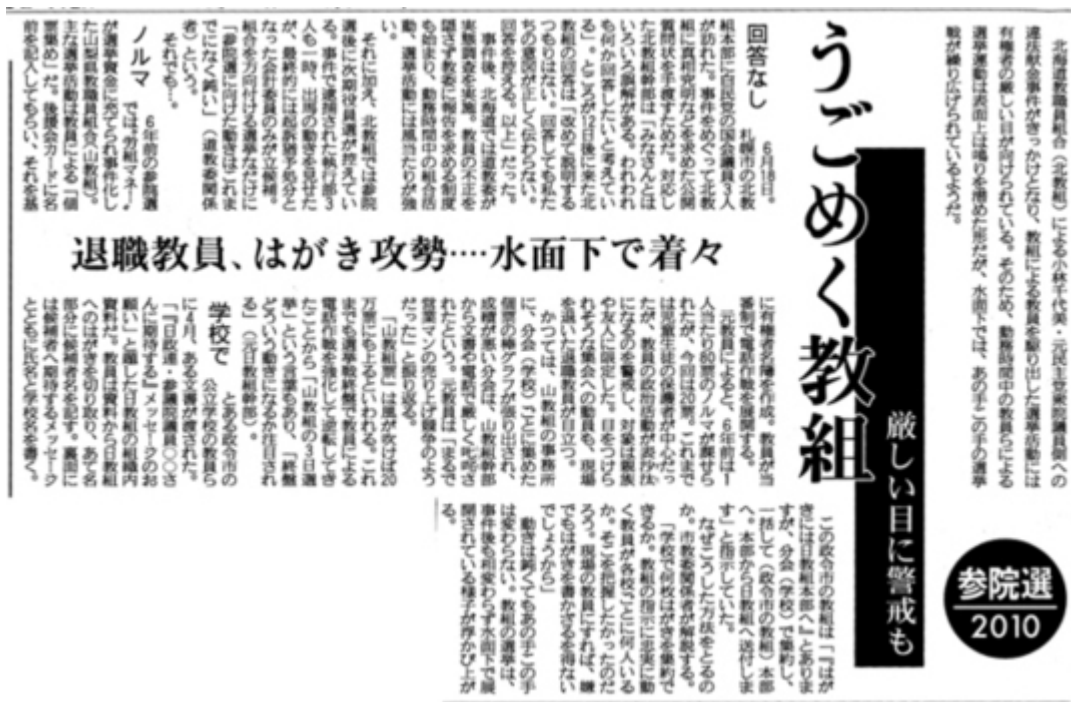
産経新聞7月6日23面に掲載された「教組選挙あの手この手」の記事 (クリックでネット記事へ)

「山教組票」は風が吹けば20万票にも上るといわれる。これまでも選挙戦終盤で教員による電話作戦を強化して逆転してきたことから「山教組の3日選挙」という言葉もあり、「終盤どういう動きになるか注目される」(元日教組幹部)。(後略)