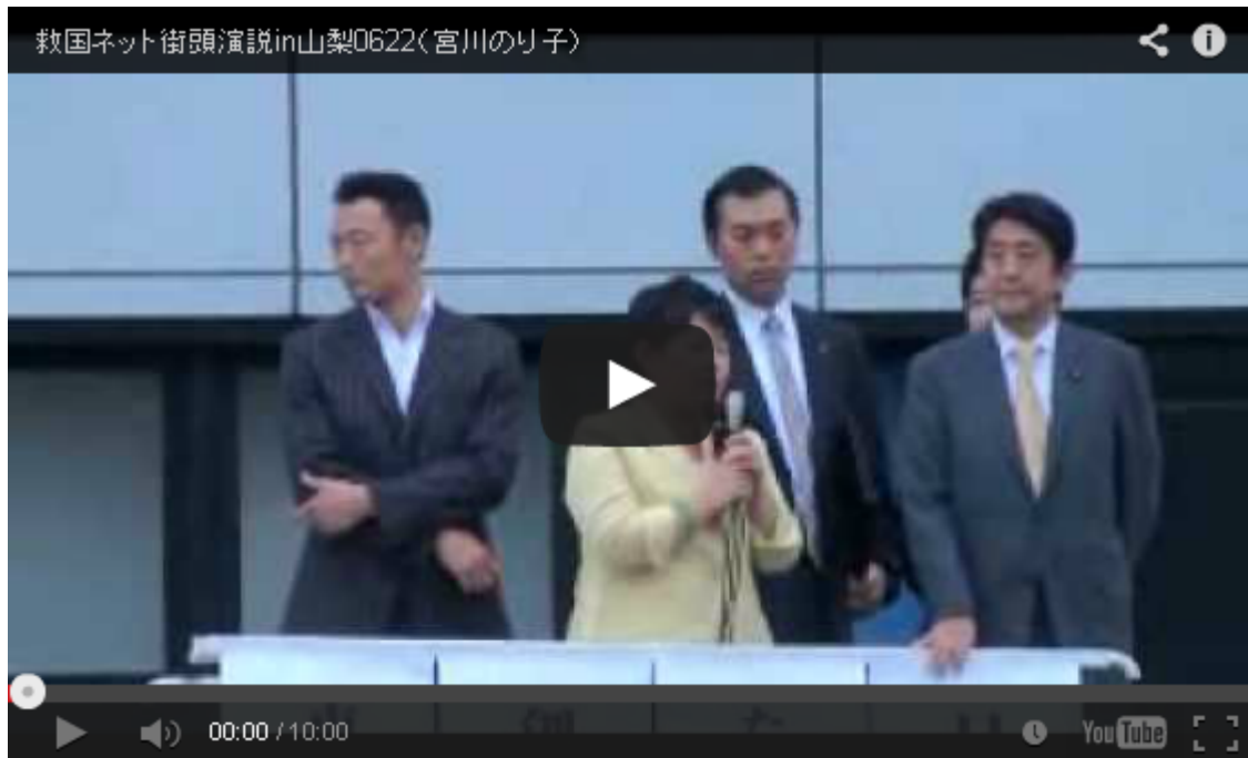
救国ネットによる初めての選挙協力(創生日本、たちあがれ日本、日本創新党)