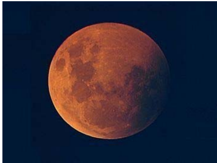
必見です。涙、涙。元気さんのブログを是非ご覧下さい！ (画像をクリックして下さい)