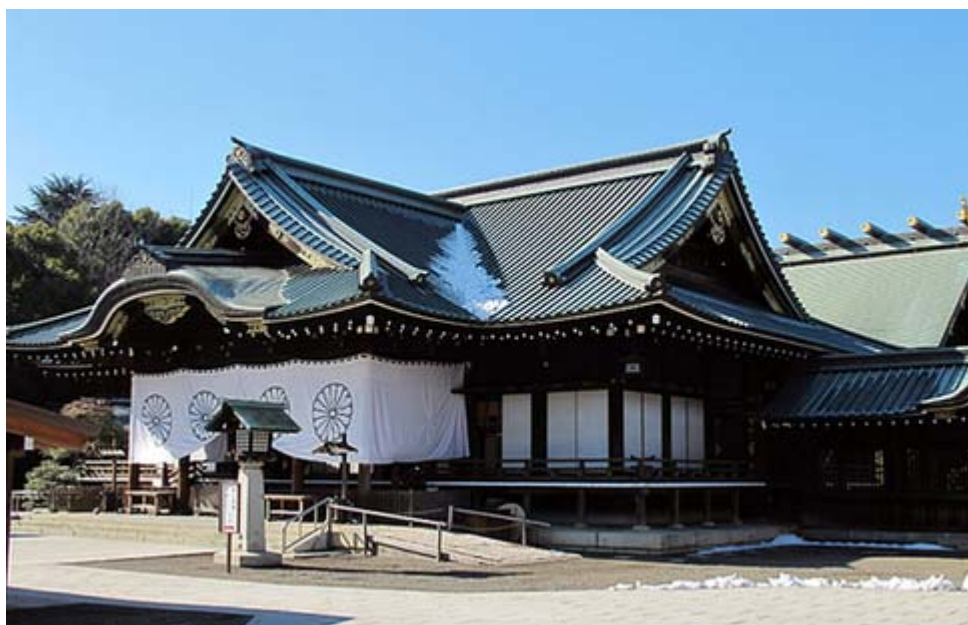
残雪の靖國神社拝殿、奥が本殿(2010年2月5日撮影)

この世界盟主なるものは、武力や金の力ではなく、凡ゆる国の歴史を抜き越えた最も古く又尊い家柄でなくてはならぬ。世界の文化はアジアに始まってアジアに帰る。それはアジアの高峰日本に立ち戻らねばならぬ。吾々は神に感謝する。天が吾々に日本という尊い国を作って置いてくれた事を。