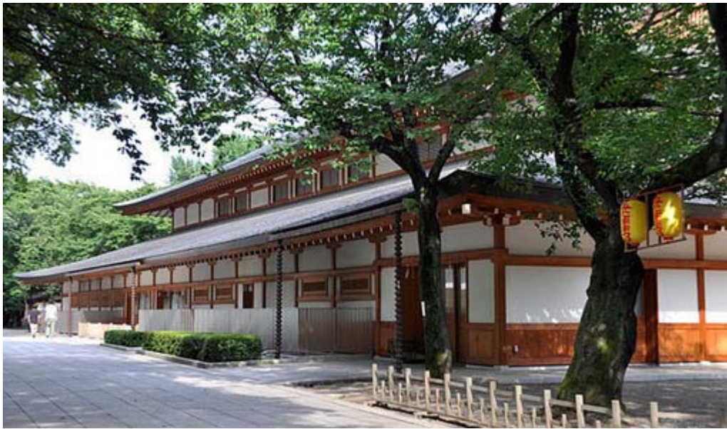
参集殿 平成16年(2004)に建て替えられたもので、個人や団体で昇殿参拝する方々のための受付や控え室があります。