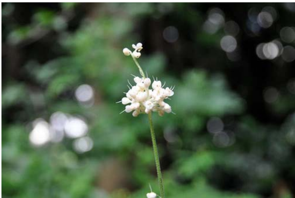
靖國神社の森に何気なく咲いていた花(実?)を接写で撮影してみました。

あとは夜の投票結果を待つのみです。時間を見つけて靖國神社に参拝して参りましたので、そのスナップ集とお知らせ、「海ゆかば」「君が代斉唱」の動画、そしてお目にかかった方と話題になった「教育勅語」をお届けします。皆さま、本当にご苦労さまでした。ゆっくりと体を休ませてやって下さい。