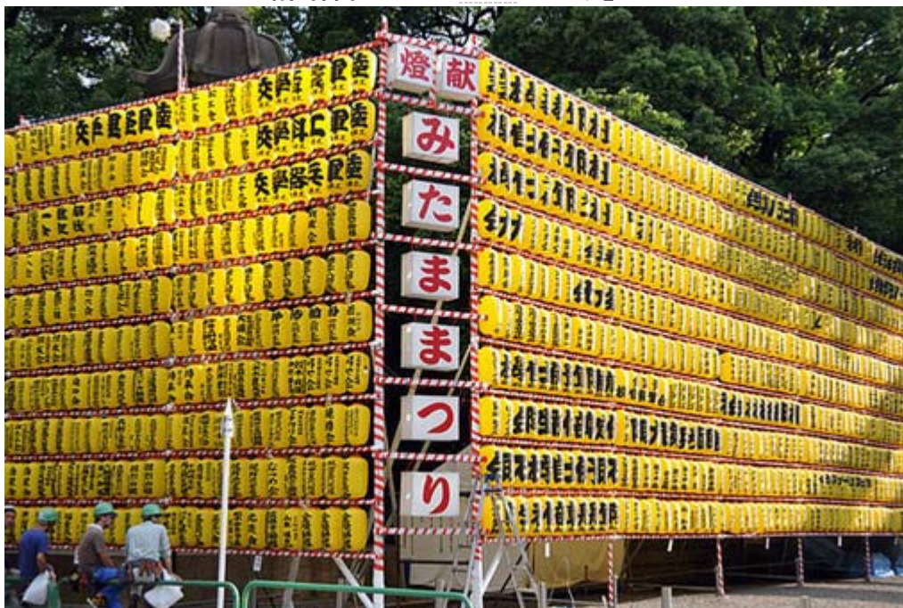
三万個を超える提灯の取り付け作業が急ピッチで進められています。