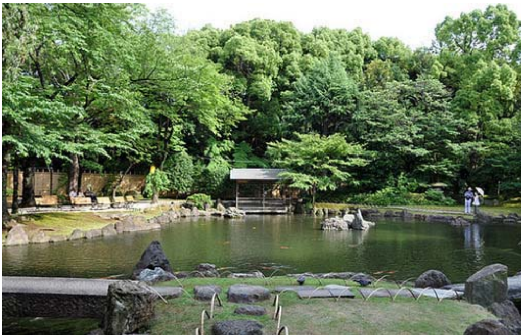
神池庭園 この庭園は明治の初めに作られたもので、平成11年(1999)の復元工事により全国有数の名園であることがわかりました。回遊式のこの庭園は、深い山の中を思わせる滝石組みが一番の見所です。