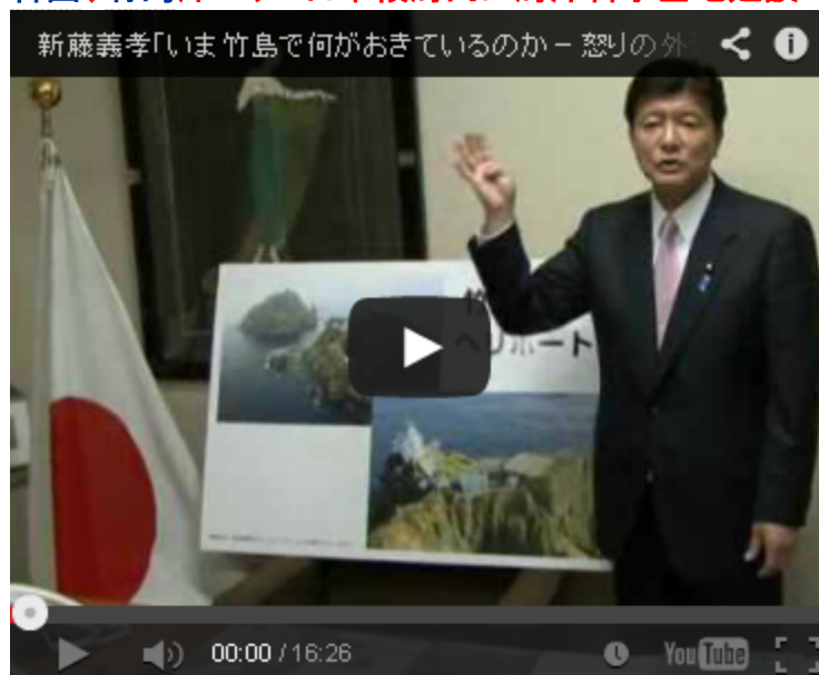
民主党政権、情報を国民に一切公表せずに黙認か？