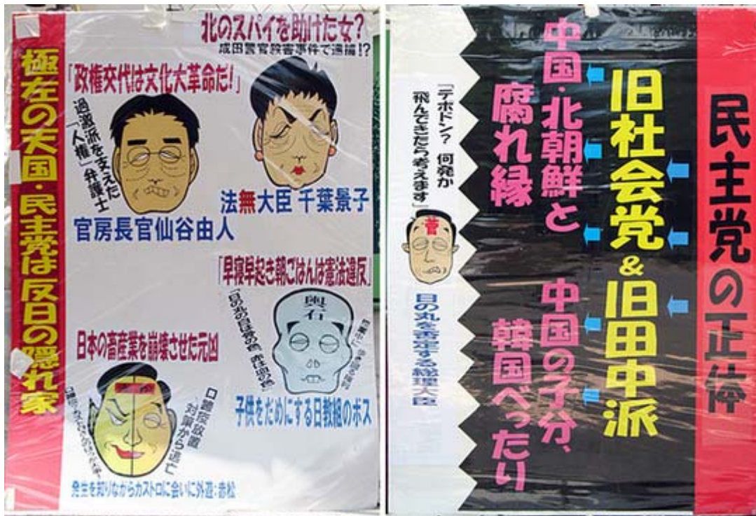
この二つの看板はいまの民主党政権の本質をズバリついています。

なお、鳩山首相の時は「ぼっぼぼ、鳩ぼぼぼ」ですっかりお馴染みとなり、東京スポーツやタ刊フジ等々にも大きく取り上げられた同会のヒット作「替え歌シリーズ」ですが、菅直人首相になってからは次のような「コガネムシの歌」や「カンカン娘」の替え歌に変わって連日スピーカーから会館前で流されています。