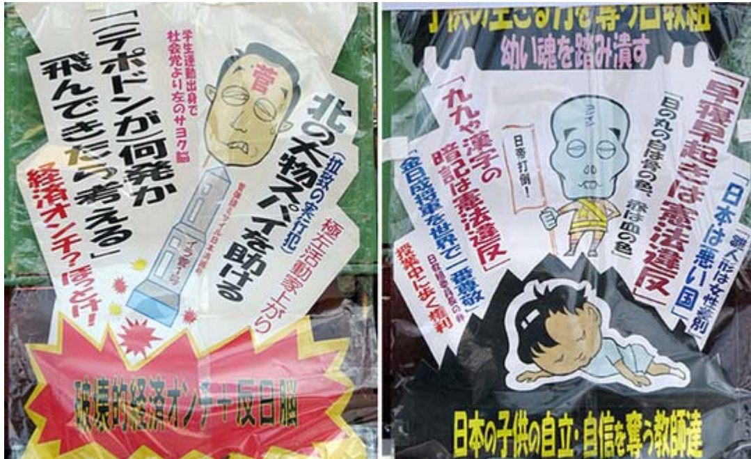
よく見ると実に良く急所を押さえたコピーが並んでいます。

売国イラ菅おめでとう 棚からぼた餅総理就任 日本の命運危ういぞ 日本の命運…危ういぞ