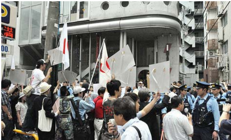
7月3日、渋谷の映画館前で行われた「コーヴ」上映の抗議行動 (主権回復を目指す会)

ワトソンは私の質問を遮ることはしなかった。途中、通信状態が悪くなり、電話が一度切れたのだが、すぐにごちからからまたコールすると、本人が出て、「 Yes sir sorry, we continue OK(すまない。続けよう)」と言ってきた。