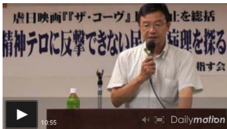
虐日映画「ザ・コーヴ」上映阻止運動を総括