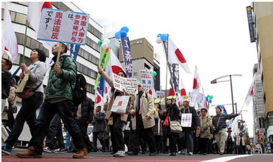
皆さんの抗議行動が実を結びました、としたいと思いますね。

二 長崎県対馬市議会及び沖縄県与那国町議会が相次いで永住外国人に地方参政権を付与することに反対する意見書を採択した。いずれも国防の要となる島である。対馬については、 韓国 資本が自衛隊施設の隣接地や旧日本軍の軍港等を相次いで買収している。