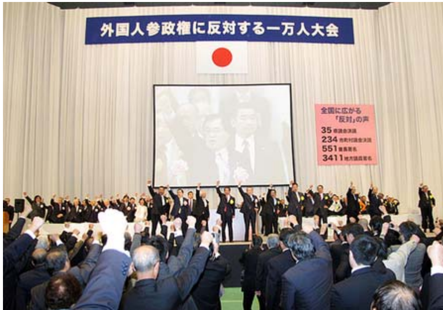
この一万人大集会在がプレッシャーになったのか?

一 外国人に参政権を付与することは憲法違反であると考えているが、憲法第十五条第一項及び第九十三条第二項の規定の政府解釈を示されたい。