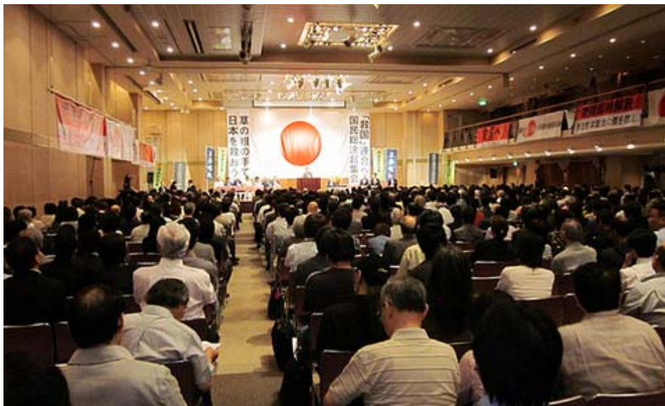
こういう集会をしなくても安心できる政権が早く欲しいですね。