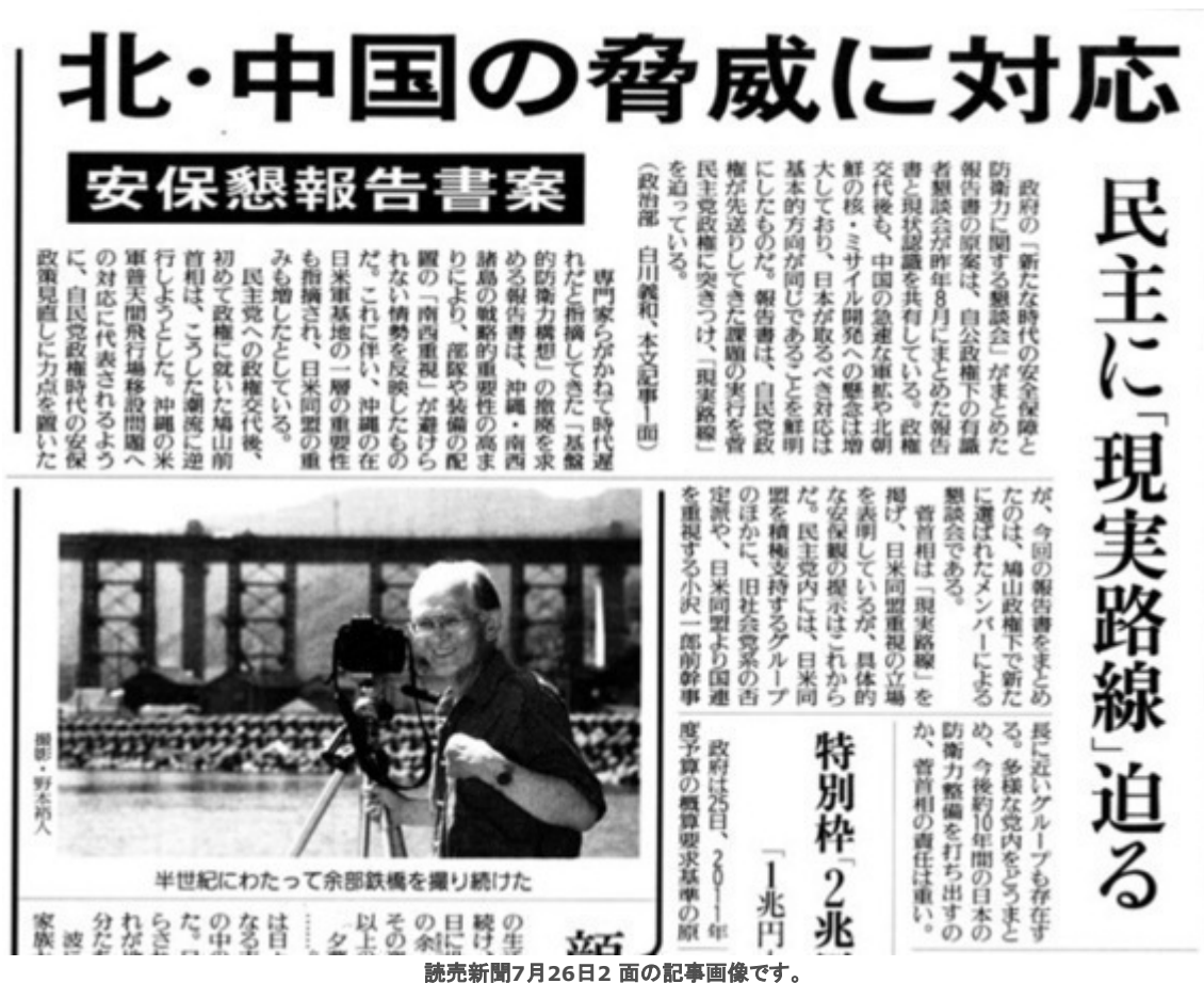
読売新聞7月26日2面の記事画像です。

具体的には、単一のミサイル攻撃といった事態への対処より、「複合的な事態の発生に対処できる機動的、弾力的、実効的な防衛力整備」を提言している。部隊配備は、全国均衡から沖縄・南西諸島重視への転換が視野にある。(後略、引用ここまで)