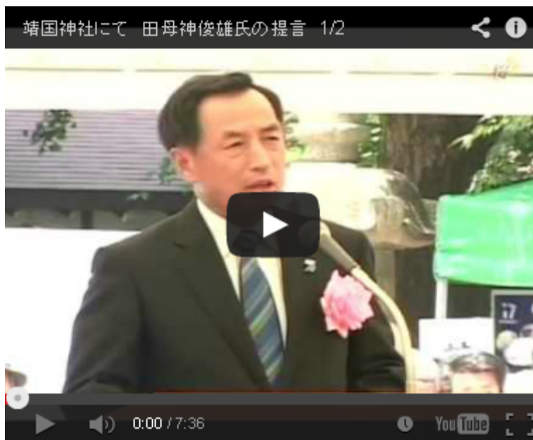
昨年中央集會のゲストで講演した田母神閣下