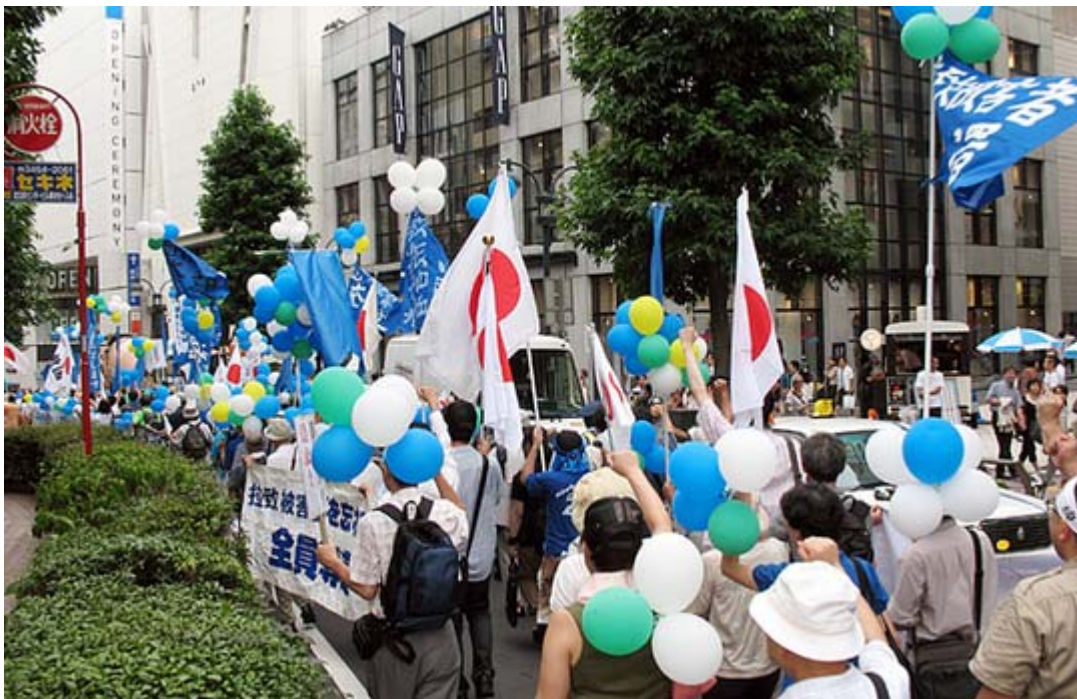
準備は大変ですがやはり風船があると賑やかになって良いですね。

ご承知の通り、拉致の救出運動のテーマカラーはブルー。この日は久方ぶりにブルーの風船をはじめブルーの幟、プラカード、ハチマキ、リボンが主催者から配布され、カラフルなデモ行進となりました。なお、デモ終了後も渋谷ハチ公前の街宣活動が続けられ、休日の渋谷に訪れた多くの人々に「拉致被害者救出」を訴えました。