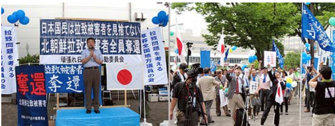
集会のステージの様子と集まった方々のスナップ。

ご承知の通り、拉致の救出運動のテーマカラーはブルー。この日は久方ぶりにブルーの風船をはじめブルーの幟、プラカード、ハチマキ、リボンが主催者から配布され、カラフルなデモ行進となりました。なお、デモ終了後も渋谷ハチ公前の街宣活動が続けられ、休日の渋谷に訪れた多くの人々に「拉致被害者救出」を訴えました。