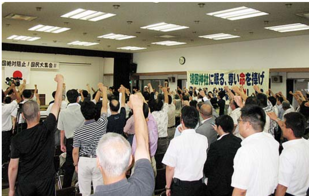
集会は気合いの入ったシュプレヒコールで幕を閉じた。 間もなく動画がアップされる予定です。

1日午後、文京区民センターで開催された「高金素梅に二度と日本の土は踏ませない」国民集会Ⅱは、満員の参加者による国家斉唱にはじまり、二時間あまりの熱い討議のあと、上記のような怒りと気合いの入ったシュプレヒコールで幕を閉じた。