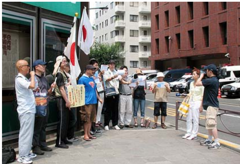
要望書を提出して台湾のメディアから取材を受ける一行。