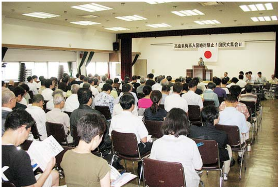
広い会場も満員の参加者の埋まり熱気が溢れていた。