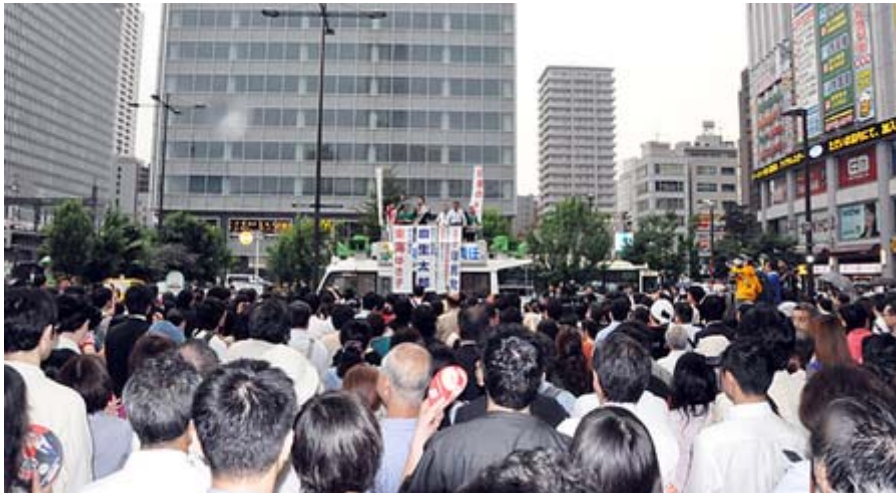
このくらい聴衆が集まってくると気合いが入るでしょうね。

前科あるとかとかたいした学歴でないとか、もしかして左翼の活動歴があって公募で落ちてたりして、と想像してみました。あの人は党本部にも意見の電話をしたと言っていましたね、そんな電話をかけてる暇があるなら、比例のチラシのポスティングに行ってくればいいのに。