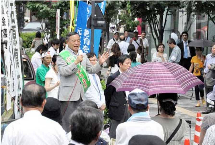
応援団も多かったのですが一歩及ばず、残念でした。

お願いする先は一般有権者、しかも選挙に行かなさそうな、行くだけけどあまり考えずイメージだけで選ぶような、そんな方たちなんです。少し選べる幅を持たせてあげてこの中からよろしく、というのがいいかなあと。