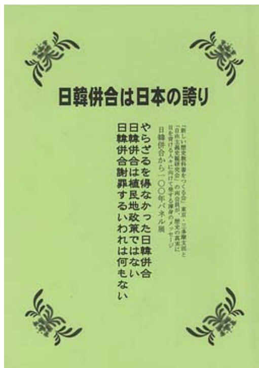
日韓併合は日本の誇り 平成22年7月15日発行 つくる会東京支部、三多摩支部、自由主義史観研究会編

実は私もこのプロジェクトの一環で行われた四回のシンポジウムのうち、二回目を受講して「 日韓併合から100年シンポジウム 」としてレポートをあげています。今回はこの小冊子からこれは是非皆さんに見て貰いたいという二ページを以下で紹介致します。「アイゴ〜〜」には大笑いしてしまいました。