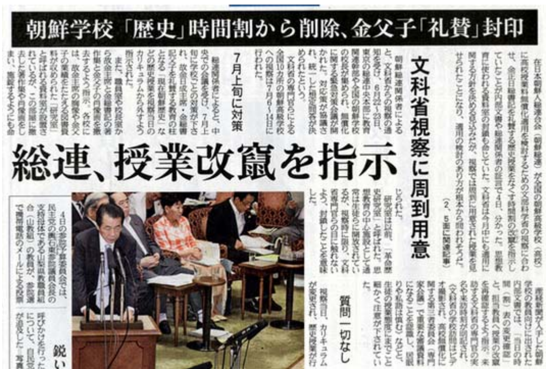
総連、授業改竄を支持とスクープした産経新聞8月5日1面トップ (画像クリックでネット記事)

思想教育に使われる資料室の封鎖も命じていた。文科省は今月中にも適用に関する方針を決める見込みだが、視察では周到に用意された授業を見せられたことになり、適用の検討のあり方が根本から問われそうだ。