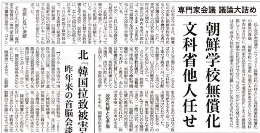
文科省他人任せと報じた産経新聞2面記事(画像クリックでネット記事)

結論から言えば、日本が好きな良識を持った日本人なら、一刻も早くこの左翼政権を潰さないと、どんどん日本の浸蝕が加速されてしまう、ということに尽きると思います。日韓併合100年の首相談話にしても、この朝鮮高校無償化問題にしても、新たな立法が必要なわけではなく内閣の意向一つでどうにでもなるのですから、「そんな政権をつくった日本人が悪い」わけです。