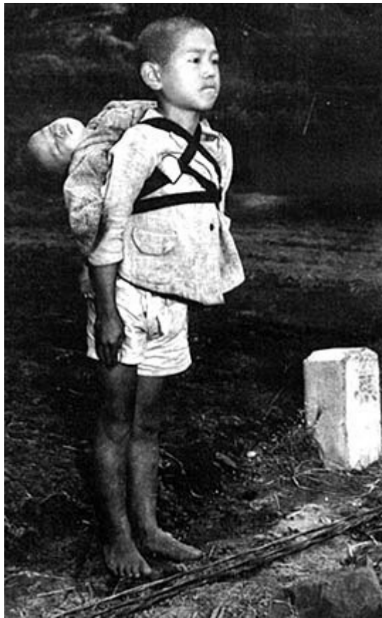
「焼き場の少年」余りにも有名な写真です。

20年前、西方では自由の風が壁を壊しました。古人(いにしえびと)の悟りは正しかったのです。近くの壁の力は弱くなり、勃興した新しい猛(たけ)き力は暖気と冷気の混ざり合った渦となり、我が国に吹き寄せています。核の国は増え続け、核の知識は広がりました。不気味な隣国の増大する核の脅威に私たちは曝(さら)されるようになりました。