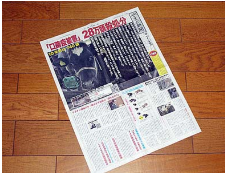
口蹄疫の真実を伝えるために発行された号外。 全国で20万部が配布されたということです。

ならば、報道は、自らの見識のもとに、是非善悪を、高い次元、高い道義をもって判断し、善なるものはこれを宣揚し、悪なるものはこれを糾弾して世論を喚起しなければならない。それがジャーナリズムの基本でもあります。