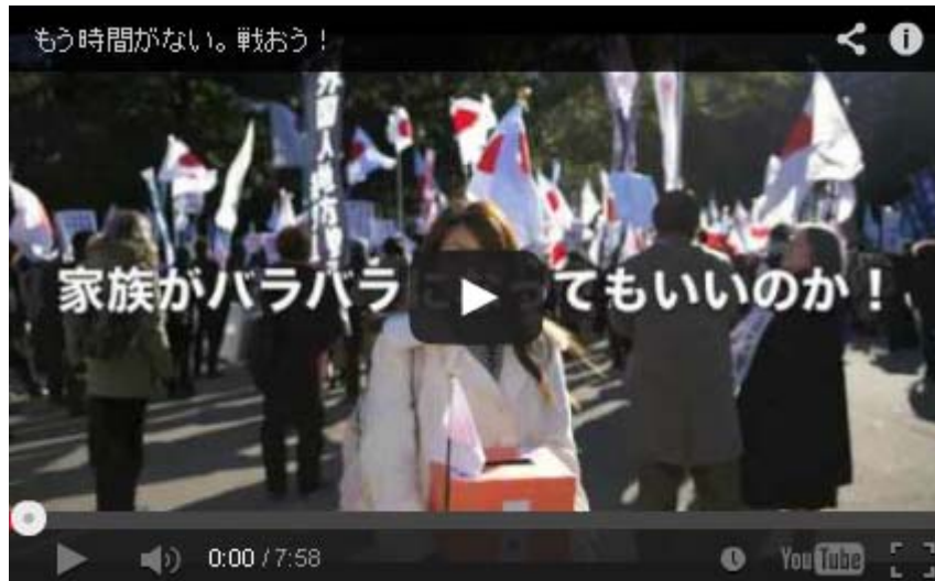
この動画、やまと新聞社作成ですが良いですね。

まさに、ジャーナリストとしての姿勢がここに明確に出ています。《やまと新聞》は、大東亜戦争の戦時中頃には、発行部数では朝日・読売等、大衆化路線を進んだ新聞社に発行部数で水を開けられますが、我が国固有の伝統と文化を護るという明確な意思をもった硬派の新聞として、根強い人気を誇ります。