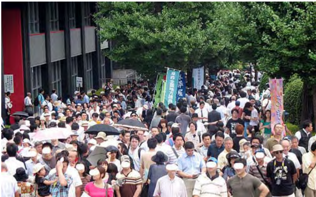
地下鉄から靖國神社に至る東京理科大前の混雑。 いろいろな団体がピラ配布や署名活動をしていました。

本当に力が欲しいと思います。日本国民の圧倒的多数は良識ある保守の分類に入ると信じていますが、いま日本で何が起きているかを知らされていません。その理由は大手メディアがニュースとして取り上げない、ある種の情報操作に加担しているからです。「社会の木鐸」という言葉は完全に「死語」になったと断じて間違いないと思います(産経、CH桜除く)。本当に情けない日本になりました。