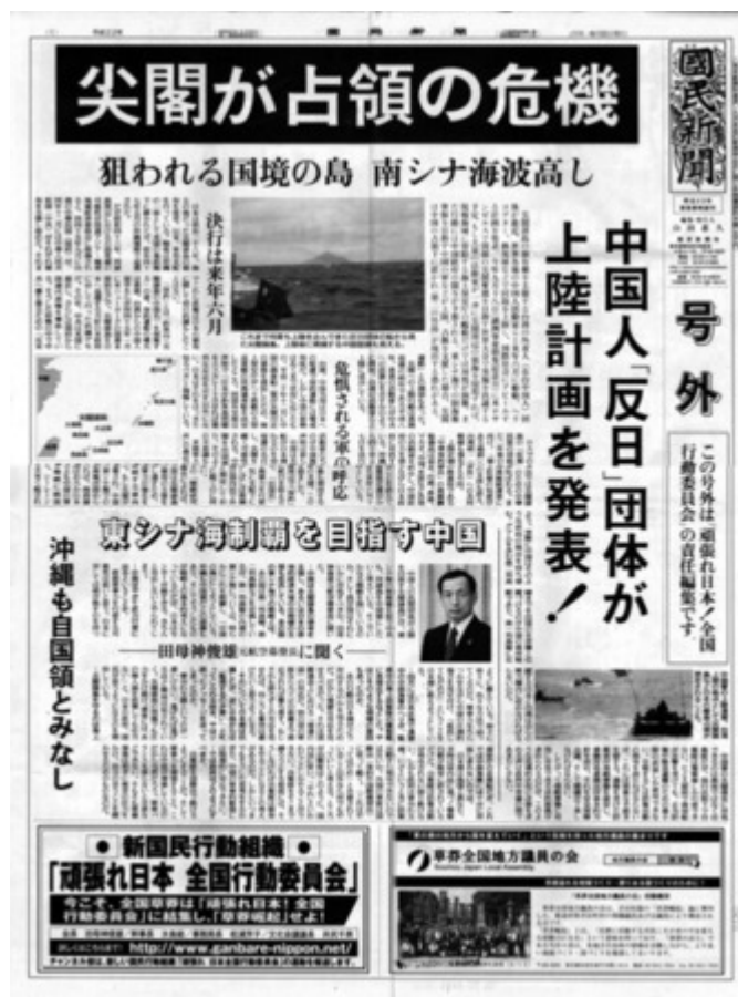
頑張れ日本！全国行動委員会が配布していた尖閣の危機 を伝えた国民新聞の号外。3万部作成して2万部を持ってき たそうです。内容は実に良くできています。

本当に力が欲しいと思います。日本国民の圧倒的多数は良識ある保守の分類に入ると信じていますが、いま日本で何が起きているかを知らされていません。その理由は大手メディアがニュースとして取り上げない、ある種の情報操作に加担しているからです。「社会の木鐸」という言葉は完全に「死語」になったと断じて間違いないと思います(産経、CH桜除く)。本当に情けない日本になりました。