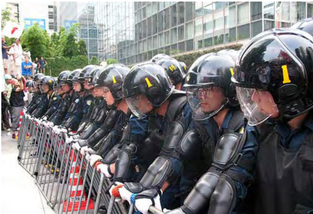
「警視庁最強！」と喜ぶ前に根本的な問題点に気がつかないのか不思議？ 日本が崩壊すればあなた方公務員も全員揃って失業するのですよ？

裁判を通じて反日団体が何をしてきたのか、何故警察はそれを取り締まらずに逆に抗議団から護ってきたのかが、多くの国民に伝われば異常国家・日本の一端が明らかに出来るのではないのでしょうか。選挙でもそうですが、結局は国民世論の力が世の中を変えるのです。力が欲しい、今回は本当にそう感じました。