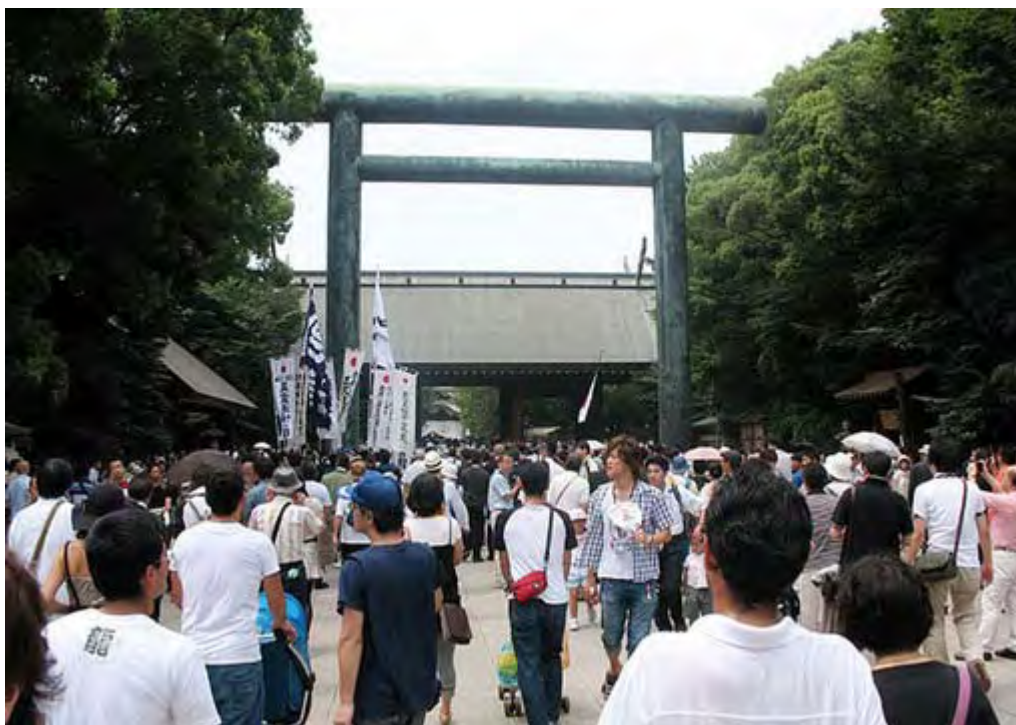
8月15日11時頃の靖國神社神門前のスナップです。参拝を待つ行列は既に神門を出てかなり長い待ち時間になっていました。

>私も昨日、チャンネル桜の方で参加しました。帰りにあの中心の交差点を渡る時に、背広を着た警察官？が機動隊の人に、「ご苦労さん、警視庁最強」と、満面の笑顔で言っていました。警察側は今回の事を、自分達の力を誇示するためにやったのではないかと勘ぐってしまいいたくなるような言動でした。<