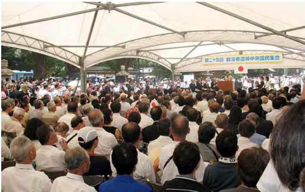
靖国神社境内で実施された第24回戦没者追悼中央集会のスナップです。

何回も書きますが、そもそもこのような反日・反国家団体の存在を許している現状自体が異常であること。堂々と反天皇、反靖国を謳うデモをよりによって8月15日に靖国周辺で許していること自体が異常。なおかつ陛下を貶める人形や、日本国の象徴である日章旗を侮辱することを排除せずに認めることの異常性を訴えたい訳です。