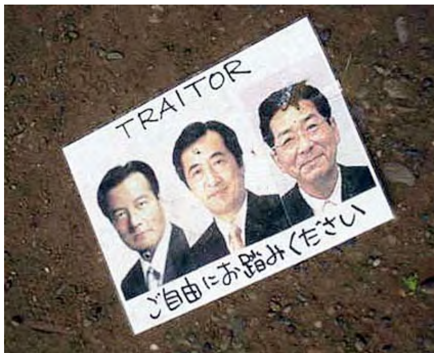
ご自由にお踏み下さいは良かったですね。誰がやったのか判りませんが拍手喝采ものです。

私は法律には詳しくありませんが、警備当局がこのような反日デモを許可しているのは、一応現行の法律に照らして「違法行為ではない」と判断しているからでしょう。専門家の意見もそうなら、これは完全に法律がおかしい、その法律が憲法違反でないというなら、憲法がおかしい、と私は思います。(現行憲法がおかしいのは保守にとっては当然過ぎますが)