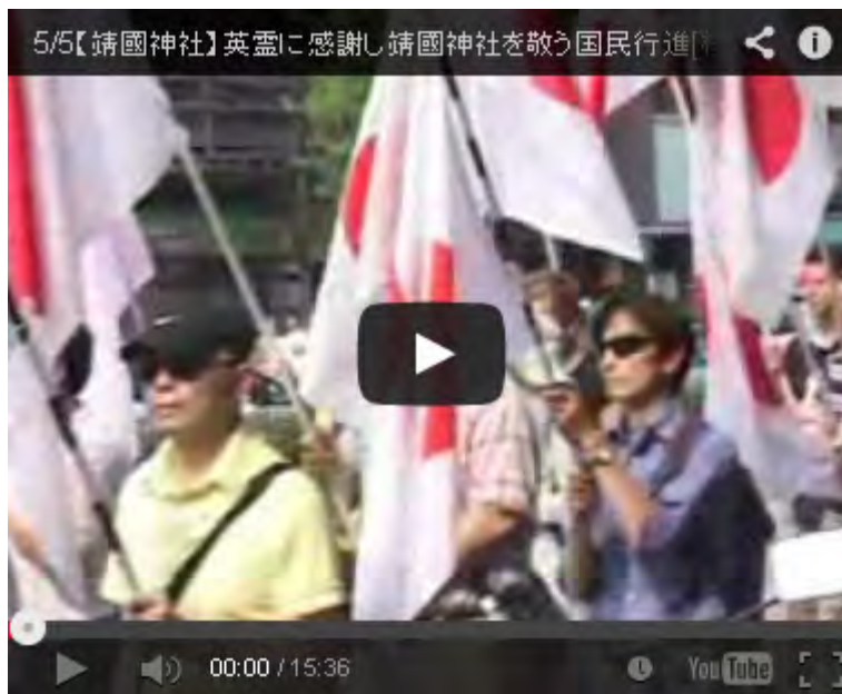
水島さんも警備隊を押して警告を受けていたのですね。 この動画ではじめて知りました。在特会の行動と変わらない、同じですよ。やるときはやらないと。

裁判を通じて反日団体が何をしてきたのか、何故警察はそれを取り締まらずに逆に抗議団から護ってきたのかが、多くの国民に伝われば異常国家・日本の一端が明らかに出来るのではないのでしょうか。選挙でもそうですが、結局は国民世論の力が世の中を変えるのです。力が欲しい、今回は本当にそう感じました。