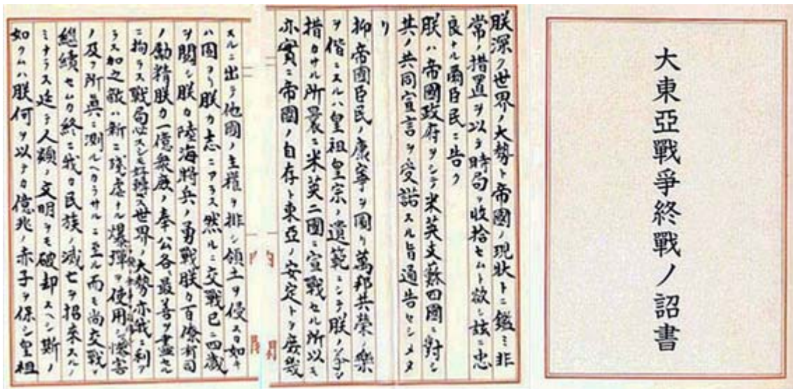
終戦の詔書の画像(連結加工は筆者・国立公文書館所蔵)