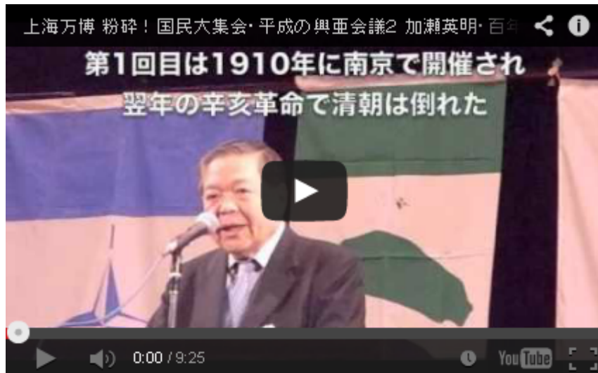
5月1日に池袋で行われた平成の興亜会議の際に 主催者を代表して挨拶をする加瀬英明氏