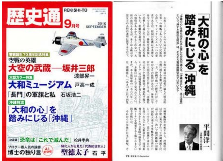
歴史通9月号は定価860円でワック出版から好評発売中です。 (画像クリックでHPへ)