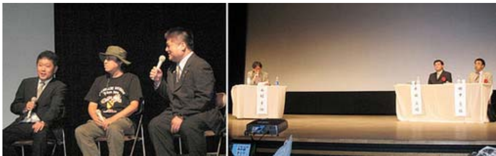
アニメのトークを行う三氏と公開討論会の三人の論客。