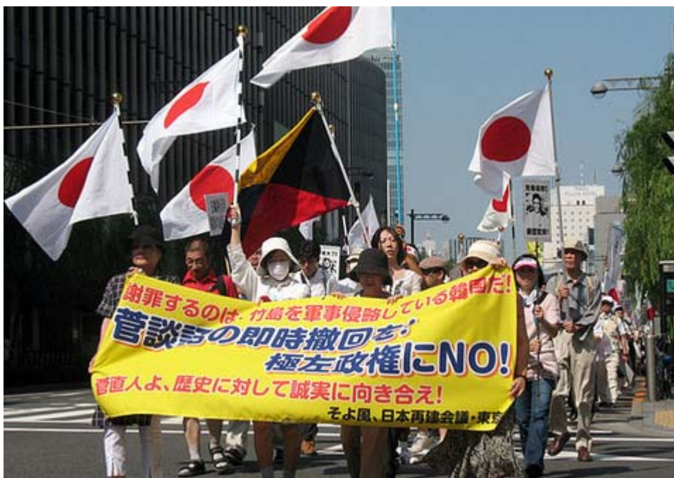
この横断幕は今回にあわせてつくられた新しいものですね。

行動する女性グループ・そよ風は22日、「もう許さない菅謝罪談話！」を訴えるデモ行進(銀座一丁目から日比谷公園)を実施、参加した約150人が銀座の繁華街に繰り出していた多くの人々に談話の不当性をアピールした(日本再建会議・東京との共催)。