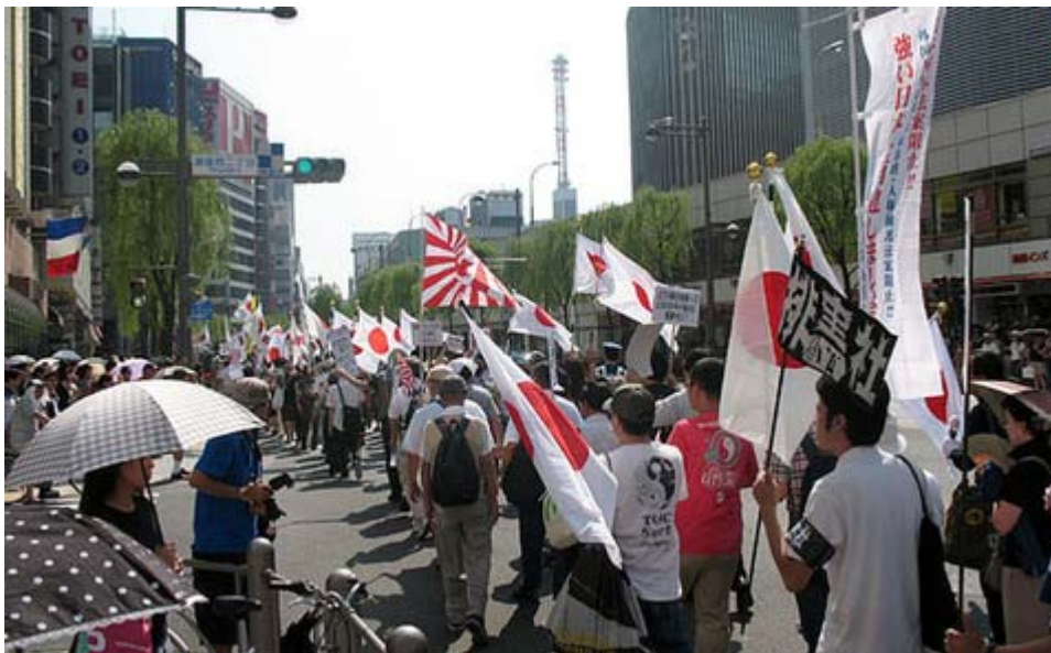
銀座ブランタン前に行くデモ隊の一行。多くの人の注目を集めた。

この時間帯は正に真夏日、予想上に集まった参加者がコーラーにあわせてシュプレヒコールをあげると、沿道からはカメラでデモ隊を撮影する光景も見られた。参加者は解散後、そのまま在特会主催の「日韓併合100周年記念行事国民大集会」に合流した。