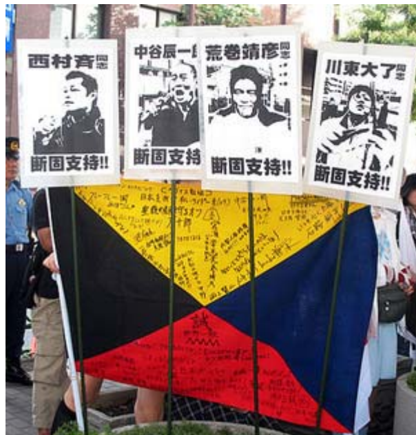
逮捕された四人を「断固支持！」と書いたプラカードとZ旗(排外社作成とか)

行動する女性グループ・そよ風は22日、「もう許さない菅謝罪談話！」を訴えるデモ行進(銀座一丁目から日比谷公園)を実施、参加した約150人が銀座の繁華街に繰り出していた多くの人々に談話の不当性をアピールした(日本再建会議・東京との共催)。