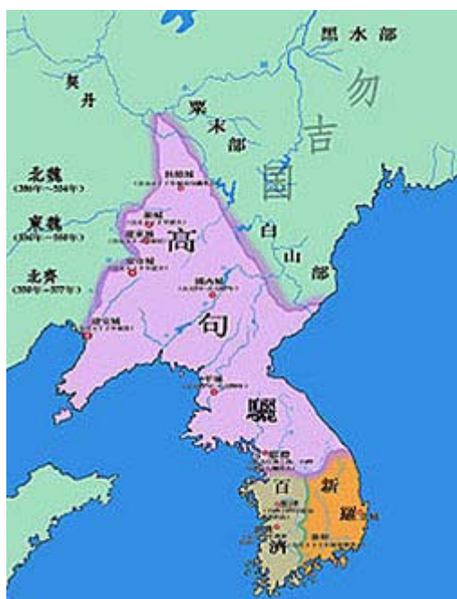
三国時代の地図、5世紀終わり頃(ウィキペディアから)

朝鮮半島の二千年の歴史をみると要は一貫して支那の属国だったわけですが、例の小中華思想と事大主義のお陰で全然不満ではなかったらしい。ところが格下と思っていた日本に併合され、35年の統治の間に世界が仰天する先進国に生まれ変わってしまって、「自尊心」が許さなかったのでしょうか。日韓関係を一端リセットして在日は一度祖国に送り返したいですね。