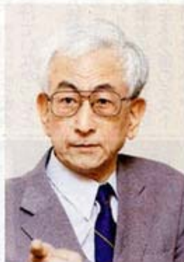
中国軍事専門家 平松 茂雄

そうしたなかで今年7月中旬、中国海軍の北海、東海、南海の3艦隊からなる「多兵種協同」の突撃演習が南シナ海の某海域で実施された。北海艦隊と東海艦隊の艦艇が二手に分かれる。台湾海峡を通過して南シナ海に直行するものと、東シナ海から、わが国の沖縄本島・宮古島の間の海域を通過して西太平洋に出、西航して台湾とフィリピンの間のパシー海峡を通過して南シナ海に入るものが確認されている。