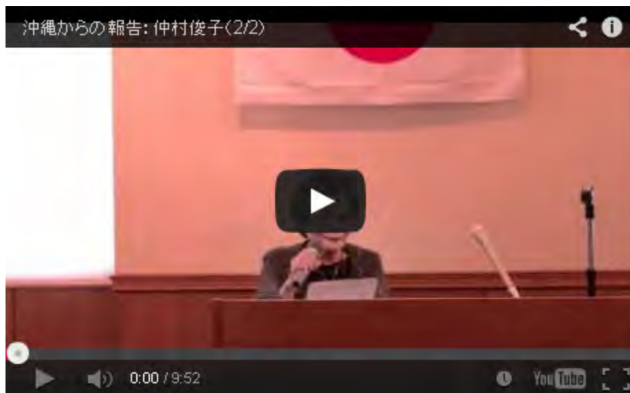
シナの侵略から靖國・沖縄・台湾・日本を護る国民大集会から(2)

まるで支那人観光客を日本人観光客と間違えているのではないか。日本人の観光客は世界中でダントツの評価を受けているが、支那人や韓国人はその逆であるという事実がわかっていない。やかましい・うるさい。不潔・汚い。ルール無視・他人の迷惑を顧みない等々、あげるときりがない。海外には支那人・韓国にお断りのホテルも多いのが現実なのだ。そして支那人・韓国人は日本の外国人犯罪の大半を占めているのが現実だ。こんな常識があっても、金が絡むと冷静な判断が出来なくなってしまうのか？。