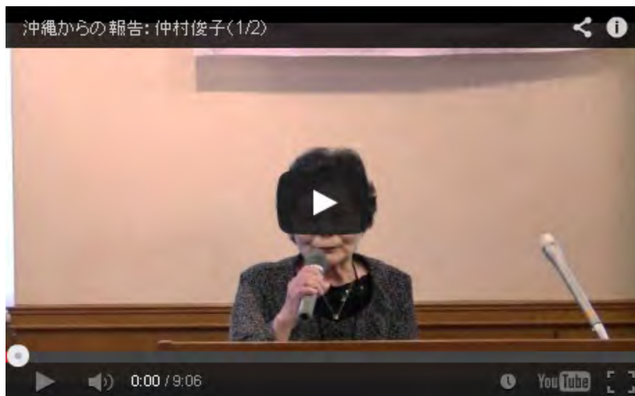
シナの侵略から靖國・沖縄・台湾・日本を護る国民大集会から(1)

この前原国土交通大臣、仲井沖縄県知事の二人については、100%左翼ではなく、まだ「多少は保守的(日本軍的)な部分も持ち合わせているかな」と思ってきた日本国民も多いと思う。私もそうだった。その二人が、大幅緩和したばかりの支那人観光客をさらに受け入れるため、ビザ要件のさらなる緩和やビザ無し観光(北京・那覇直行便も)に言及したのだから、あきれてものが云えない。支那人を大量に日本に入れることの危険性がいつから見えなくなったのだ？と。