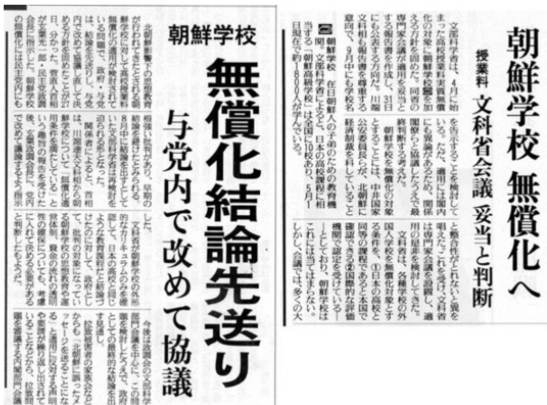
左が産経新聞、右が読売新聞の28日朝刊の記事画像

で、この情報を取り込んで一面トップ四段見出しで報じたのが28日の産経新聞、読売新聞は同じ一面三段見出しで報じたものの、「党にあずける」部分を見逃して平凡な記事にとどまっています。見出しの比較でも受ける印象が全然違いますね。