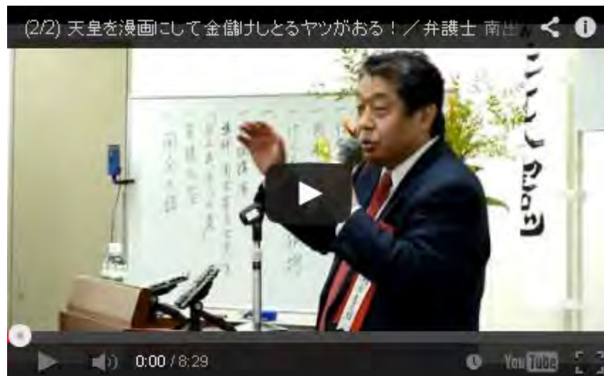
天皇を漫画にして飯食つとる奴がおる！

それと本号には渡部昇一氏の「小林よしのり氏への公開質問状2」が掲載されています。その質問の中に「小田村先生や小堀先生や私をカルト集団」だと云っておられます、という文言があります。いよいよ小林よしのりも狂ってききましたね。またこんな漫画を平気で掲載している花田編集長の「商売優先」の編集姿勢にもいい加減嫌気がさしています。私は既に同誌の定期購読を止めました。