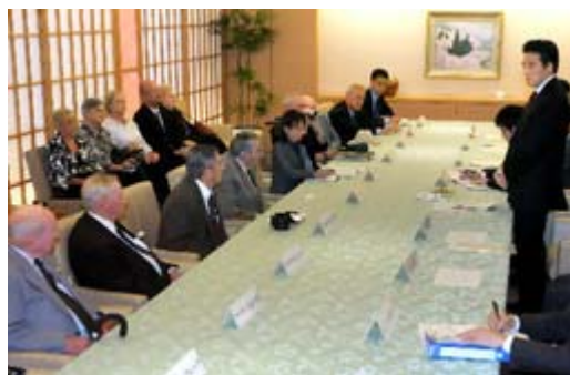
来日した米国人元捕虜と面会する岡田克也外相(右) ＝13日、東京・霞が関

岡田氏は「非人道的な扱いを受け、ご苦勞され、日本政府代表として、外相として、心からおわび申し上げます」と述べた。(2010年9月13日13時25分 読売新聞)