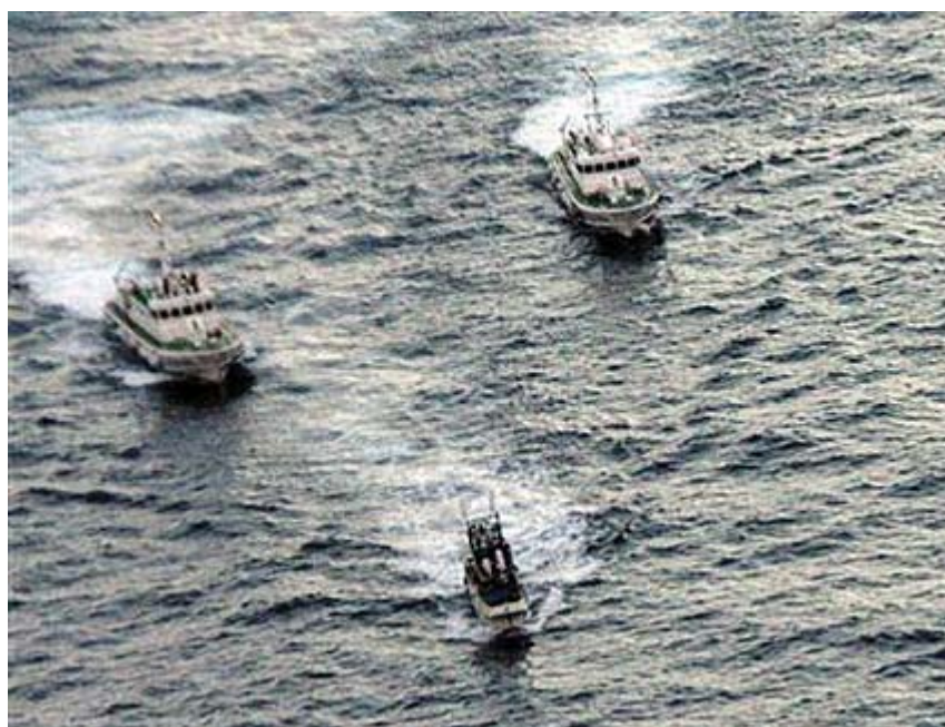
尖閣諸島周辺海域を航行する台湾の漁船。後方の2隻は海上保安庁の巡視艇＝14日午前6時ごろ