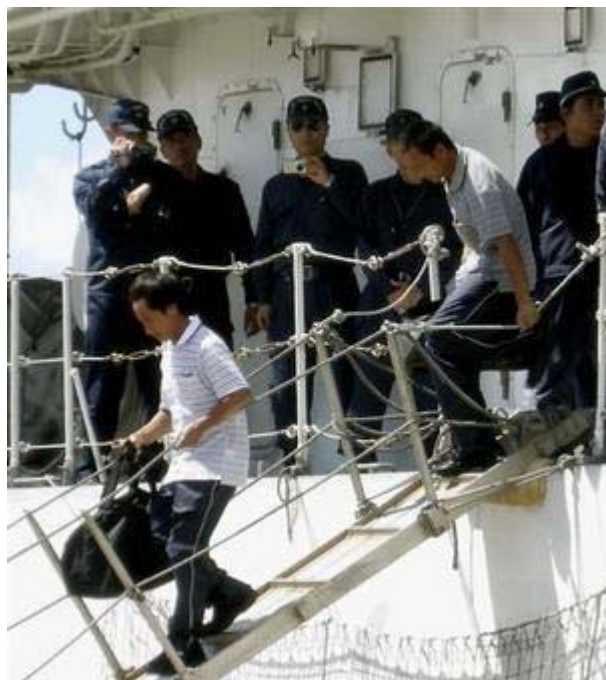
帰国のため、海上保安庁の巡視船を下りる 中国 漁船の乗組員ら＝13日午前11時ごろ、沖縄県・石垣港(産経ネットから、若い男ばかりですね?)

日本政府が早急に自衛隊を出動できる体制をとるためにも、政治家、 防衛庁 、マスコミへこの情報を拡散をお願いします。(JSN代表 仲村)