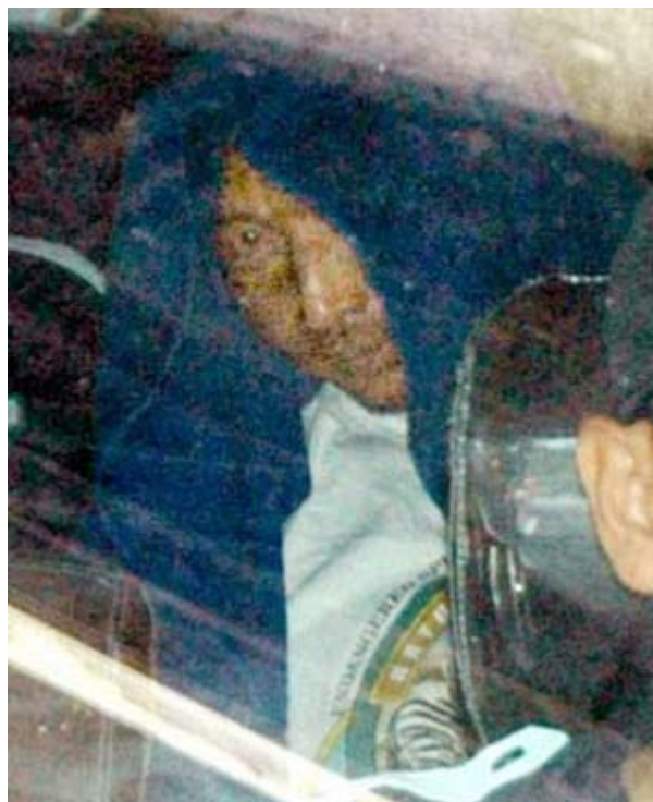
逮捕された侵犯船のシナ人船長9月8日

【緊急拡散依頼】JNS■ 2010年09月14日 17時52分34秒 | 梁光烈(国防部長)土曜日に帰国し作戦会議を開き 中央対日最後通牒を出した