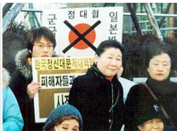
この二枚の写真はあまりにも有名になりました。日本人か否か、怪しい気がします。