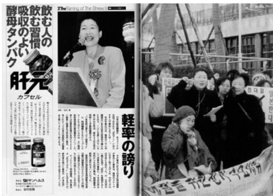
週刊新潮 2002年(平成十四年)2月27日号