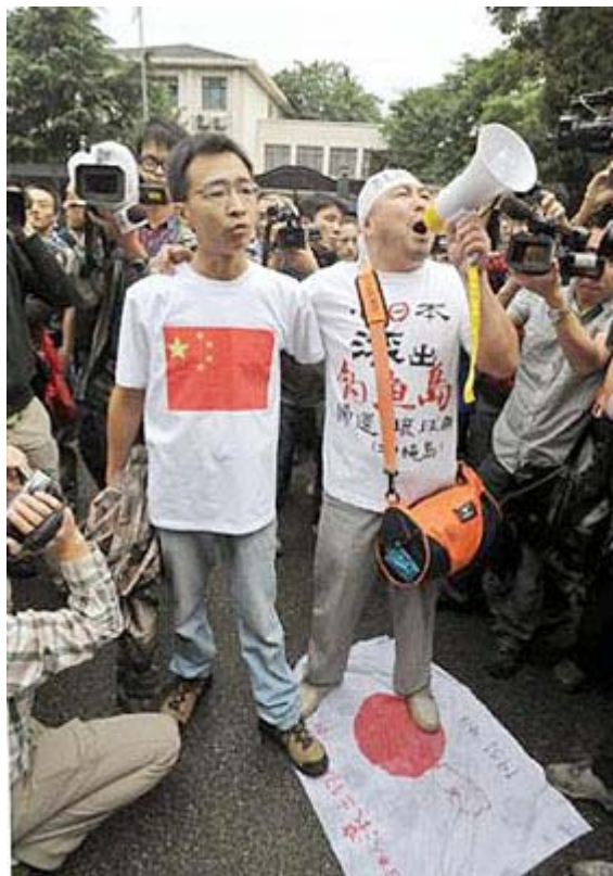
左側の男、もっとシャッキとした表情は出来ないのか？ これでは「間抜け顔」に見えるよ。

案の定、10日間の拘留延長でギョアギョアうるさいですね。これで「起訴」したら最終警告へ！、「三年の実刑判決」でも出したら支那の海軍が尖閣・沖縄に攻めてきそうな雰囲気ですよ。日本政府も「国内法にのっとって肅々と」やらざるを得なくなってきました。一歩も引かずに頑張ってください、というか中途半端な妥協をしないよう、ガンガン意見を首相官邸と外務省に寄せましょう。