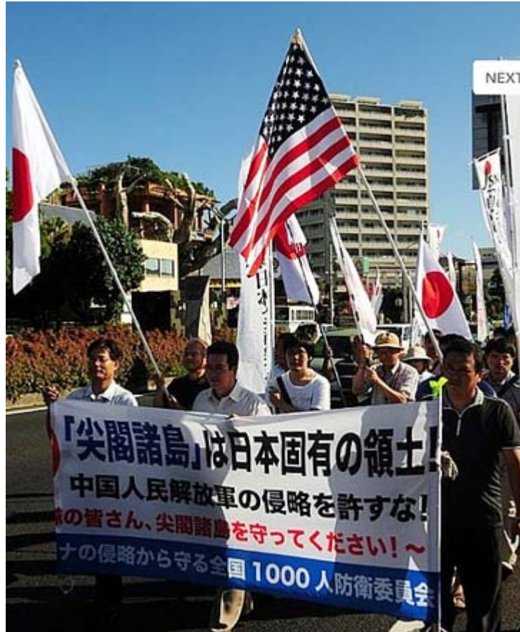
沖縄で「尖閣は日本の領土」を訴えたJNSのデモ行進。 日章旗と星条旗の組み合わせはほとんど見た記憶がありません。

らの帰化申請の受付を一時的に中断したらどうか。中国人留学生を全員所轄官庁に呼び出して状況の審査を行い、在日中国企業に税務査察を送り込んだり、このチャンスを生かし、日頃の不正を暴く必要があるのではないか(9月22日付け)と提案していますが、政府がやらなければ民間人の我々が実行するしかありません。これは人ごとではなく、私達自身の問題ですよ。