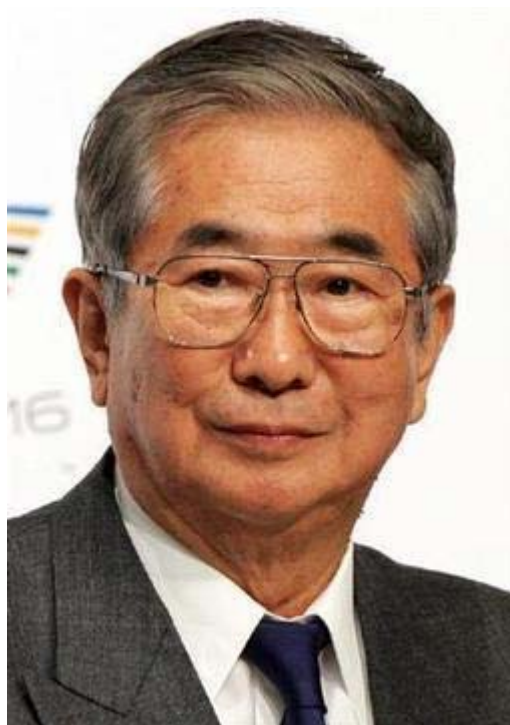
この人が総理大臣だったなら…

民主党政権糾弾！「国民集会」のレポートを優先させたので後回しになってしまいました。21日には、注目すべきニュースが重なりました。尖閣に関する日本側の対応で、掲載した石原発言と那覇市議会の決議、そして馬淵国交大臣の中国国家観光局副局長の表敬訪問拒否のニュースです。これに前原外務大臣の発言くらいが目下のところ日本側の対応として評価できるものでしょう。まずはご覧下さい。