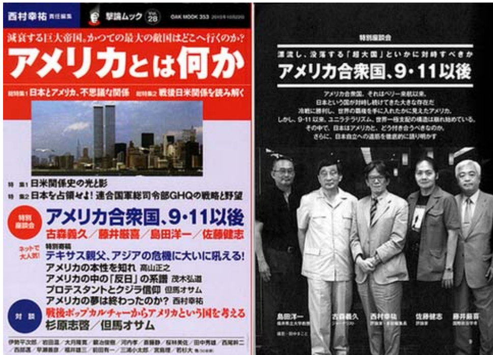
撃論ムックは税込1200円でオークラ出版から好評発売中です (画像クリックで本誌のHPへ)

本号にはIZAブログでもお馴染みの古森義久氏と島田洋一氏（既にブログで簡潔に紹介されています）が座談会と寄稿を寄せてくれているので、余計に親しみが湧きます。紹介が遅れましたが22日から全国の書店で発売されていますので、皆さま、是非ご覧下さい。以下、目次ページ(全216ページ)の抜粋を掲載しました。好評の西尾幹二、西部邁両氏の連載ももちろん掲載されています。