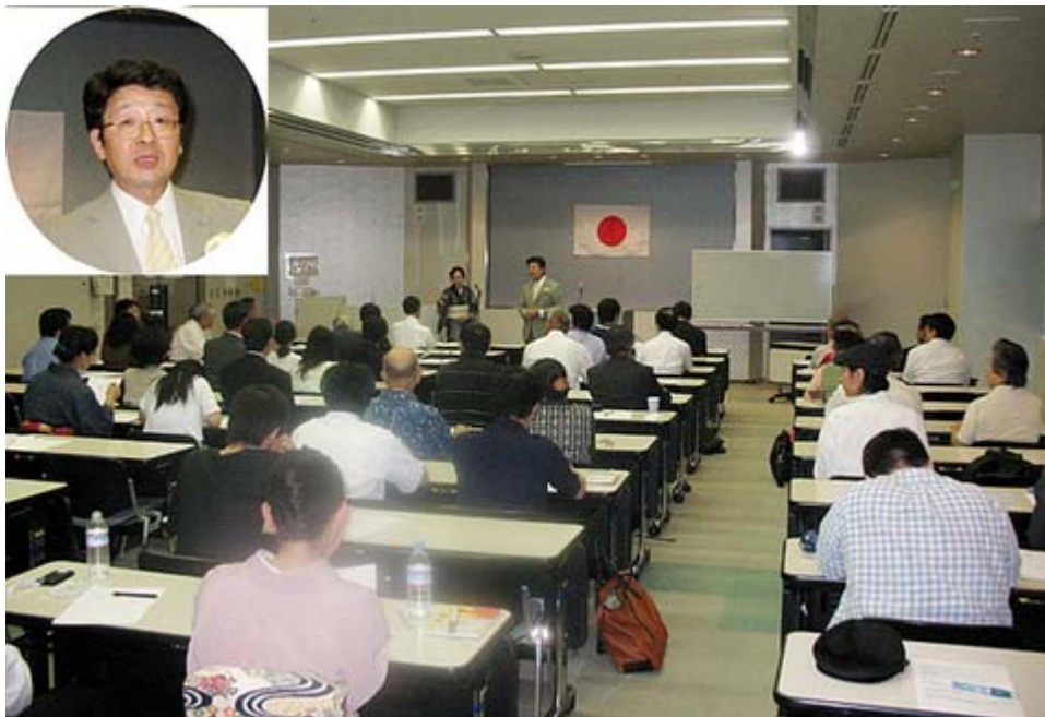
「日本の心を伝える会」と「愛国女性のつどい花時計」は19日、池袋の東京芸術劇場で「日本の神話勉強会」を開催、三連休の間の日曜にも拘わらず約60人が参加し、講師の高森明勅氏の話を熱心に聞いた(写真)。