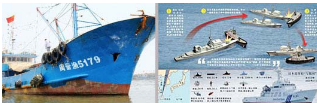
日本ではなかった筈の穴があいた漁船と、海保の船が漁船にぶつけたと主張する支那側のイラスト図

それにしても日頃、反戦平和を訴えている人権団体ほかの左翼系はもの見事に沈黙していますね。あなた方に云いたい、日米同盟の米軍の追い出しに必死で、日本侵略を加速させている支那中共の恫喝・横暴には何も言わないのですか？と。そこまで日本を貶めたかったら支那人に帰化して日本を攻撃すればよろしい。さっさと「日本から出て行け！」、この言葉をプレゼントします。日本の真の敵はあなた方です。