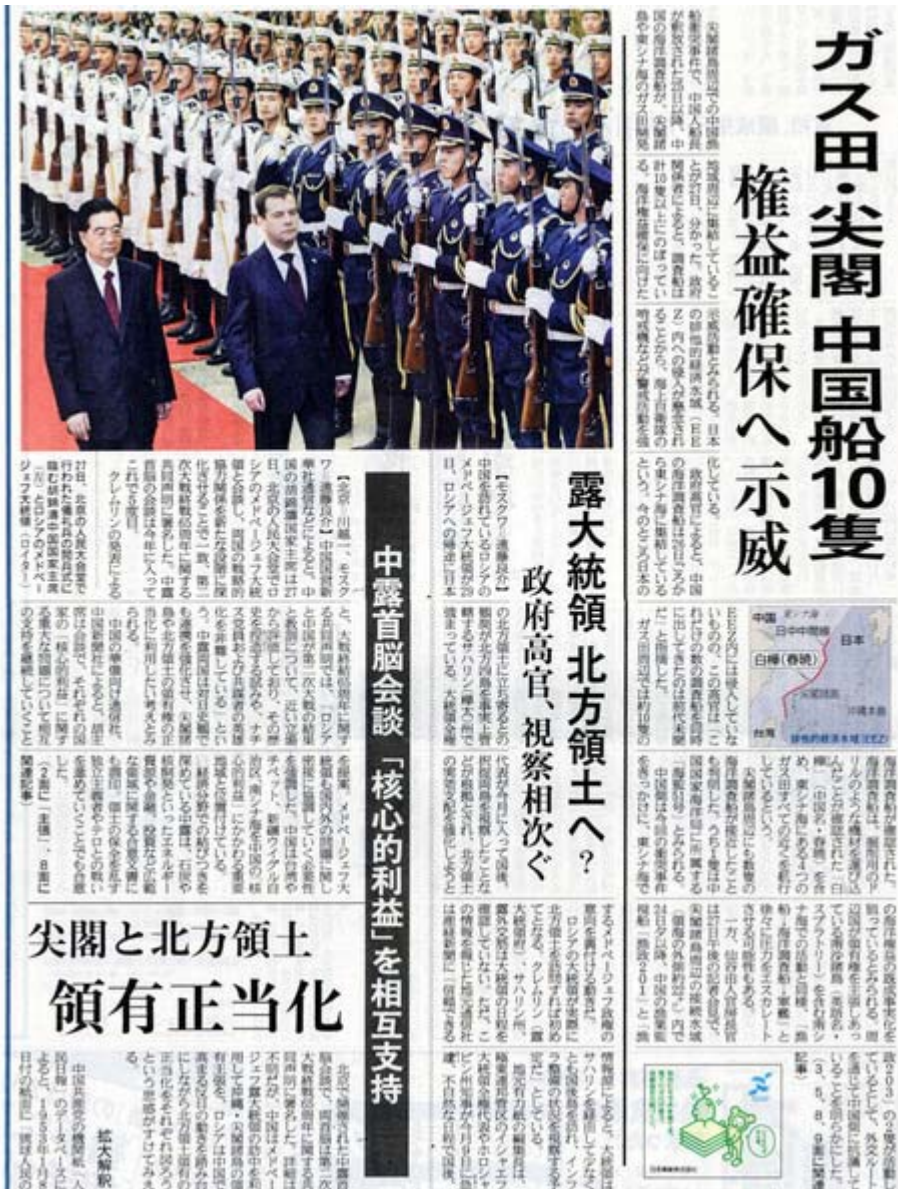
中露首脳会談を伝える産経新聞9月28日1面トップ記事の画像 (クリックで北方領土視察の記事へ)

中国がロシアに同調すれば、日本を標的に歴史を歪曲(わいきょく)し、領土という共通利益を正当化するための共同戦線を両国が構築したことになる。尖閣諸島沖の中国漁船衝突事件で日本が毅然(きぜん)たる対応を示せないことも中露に乗じるべきを与えていよう。菅直人首相は直ちに両国に抗議し、反論すべきだ。(後略、産経新聞9月28日付け主張から)