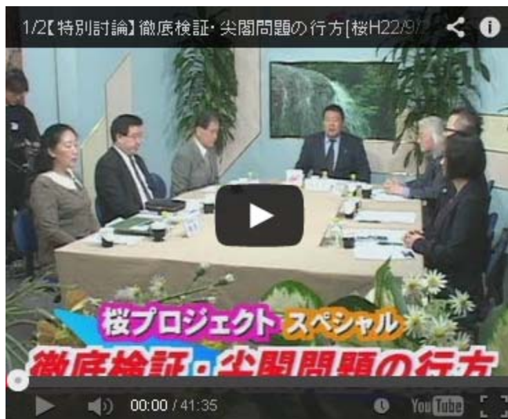
続きはこちらをクリック