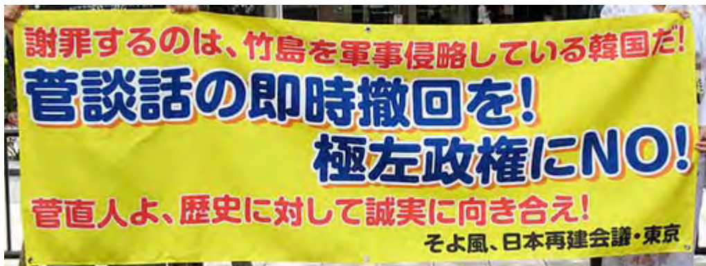
菅談話の際につくられた綺麗な横断幕。 日本再建会議が積極的な活動に転じていますね。

皆様、この尖閣問題で沖縄地検がシナ人船長の釈放を決定したと報道されておりますが、そんな権限が検察機関にあるはずがありません。政治圧力をかけた者がいるからシナ人犯罪者が釈放されたのです。私達は政治圧力をかけて日本の法治をねじ曲げた民主党政権を絶対に許す事はできません。