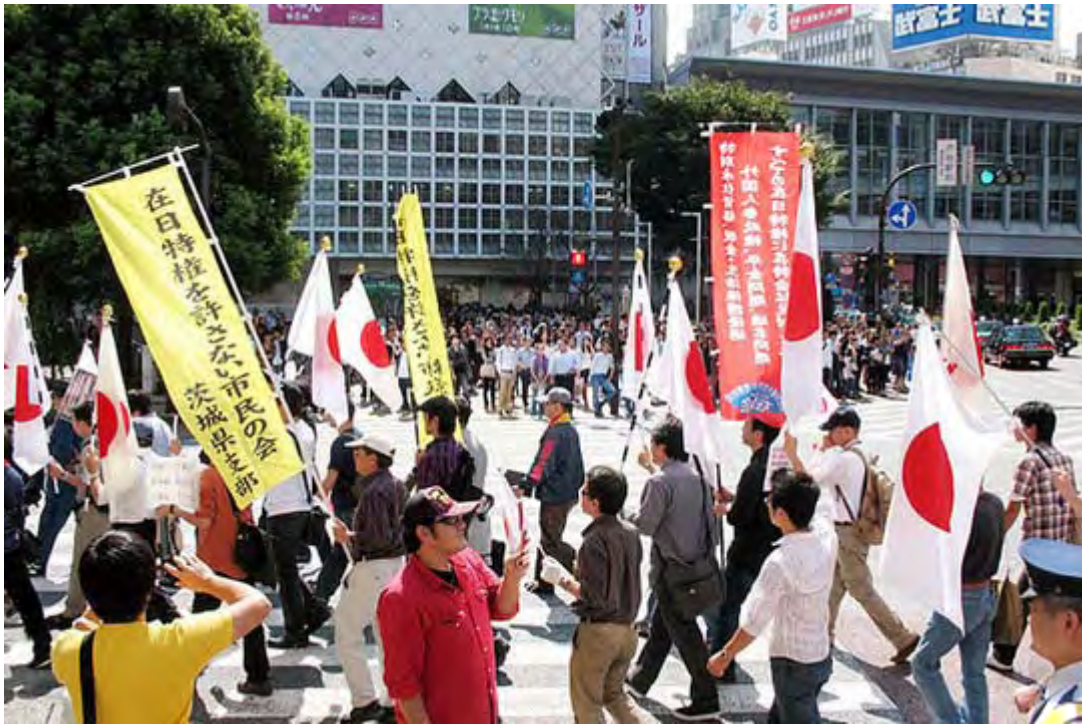
向こうがハチ公前広場。この場所は一番人の目に触れるポジションです。