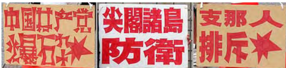
刺激的な文言が並ぶプラカード

しかしながら、我ら心ある日本国民は断じてそれを了としな。政府が敗北を喫しても、我ら国民は「徹底抗戦」を訴える。いまや我が国には七十万人にも及ぶ在日支那人が住み、来日観光客と合わせ激増中であり、まさに「人口侵略」そのものである。