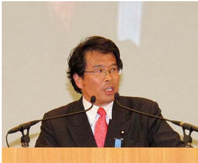
4月17日、日本武道館で行われた「外国人参政権に反対する国民集会」(一万人)で スピーチ する松原仁議員。

在日の方々を批判しているわけではありませんよ。国籍というのは、それほど重いものであり、どこにしようと自分たちが最終的に帰属する国家の利益になるよう努めるのは、当然のことですから。しかし繰り返しになりますが、 民主党 が挙党態勢で経済再建を成し遂げ、政権運営の若葉マークがとれれば、この問題もおのずと国益の観点から議論されるようになると思います。そして将来的には、 自民党 政権では実現しなかった本物の国益を追求する政治ができるようになるかも知れない。