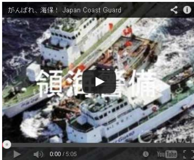
「この国は少し変だ! よーめんのブログ」さんから

再建を成し遂げるため、これまで以上に活動していく決意です。(正論11月号、P222-PP224)