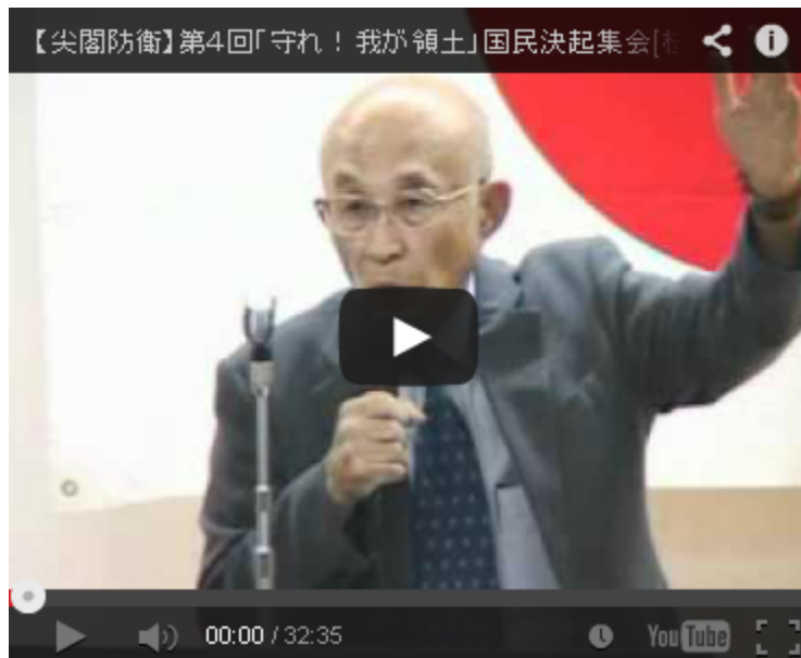
「守れ！我が領土」国民決起集会の動画です。

ここで怒らなかつたら日本人ではないでしょう。事の重大性を理解できる政治家なら、自ら率先して「全ての日本国民に土下座してお詫び」し、直ちに内閣総辞職というのが当然の局面です。官邸前では連日、デモや街宣が数千人規模で行われ、無数の「生卵」が官邸に向かって投げつけられてもおかしくない、と私は思いますよ。という訳でお知らせです。