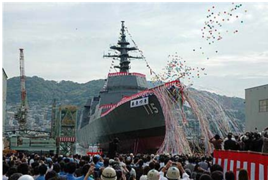
新型護衛艦「あきづき」進水に歓声、三菱重工長崎造船所 (画像クリックでネット記事へ)

・そして世界に「日本が目覚めた」と訴え、国防安全保障については「一歩も引かない」ことを、つまり普通の国になることを宣言すべきなのだ。菅内閣は「与野党が求める尖閣のビデオを公開したら日本人が激高して日中正常化が三年以上遅れる」から公開しないという。一体、どこの国の政府なのだ。それほど、日本国民に客観的な証拠を開示したくないというなら、本当の真性売国内閣ではないか。