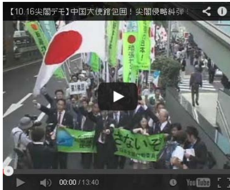
こちらはデモ行進編。左翼が妨害するシーンも含まれます。

決定的だったのは支那中共サイドのメディアまでがこれに追従し、ネットで反日言論が沸騰していたことです。これに「火に油」だったのが中国のニュース・サイト、環球網が15日、「日本の右翼団体が3000人による駐日本 中国大使館 の“包囲攻撃”を計画」という予告記事を15日に配信したことです。