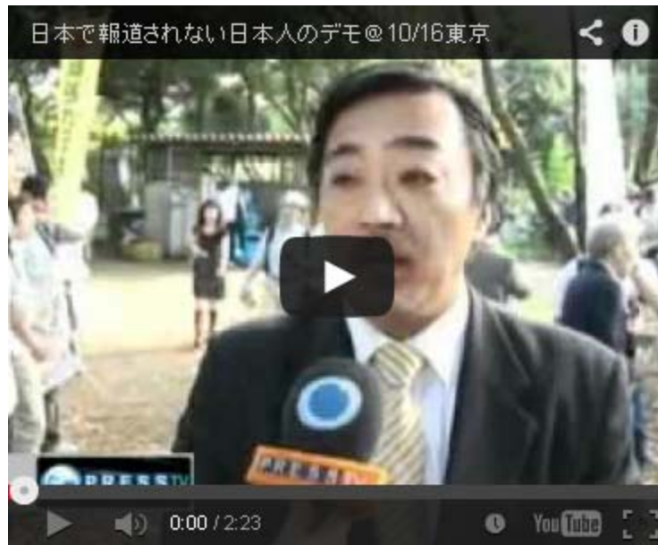
NHKでもこのくらいの内容を夜7時のニュースで流すべきでした。

NHKサイドはこのデモ隊の主催者が一万人訴訟の当事者とほとんど同じであることを知っている筈ですし、日放労の極左体質からすると上記の映像を流すことは「我慢がならない」事態に違いないと思います。品のない言い方ですが、「ざまあみろ、風穴を開けたぞ！」と、ちょっと嬉しい気持ちです。