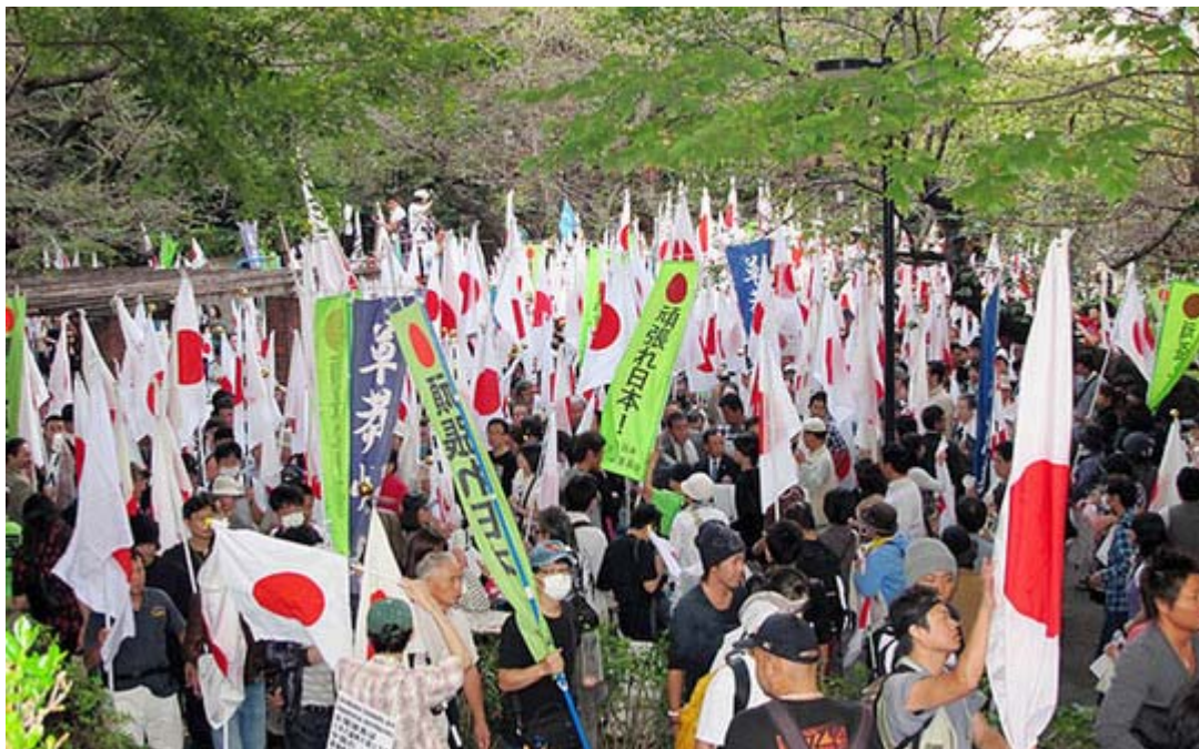
デモ終着点の三河台公園。とても入りきれずに 中国大使館 に向かう隊列と到着する隊列が入り交じっての大混雑となりました。

日本のデモと同時刻に支那の三カ所で「官製デモ」が行われたのです。実際は暴動に近い「支那人の野蛮性」が浮かびあがり、日本の整然としたデモと好対照でしたが。これは当然、日本のメディアが大きく扱いましたが、その原因となった日本側のデモをこれまで報じてきませんでしたから、まるで話の整合性がつかない、ひと言で言う「みっともない」醜態を自らさらけ出していました。仕方がなく、16日は申し開き程度に小さく扱った、という結果になりました。