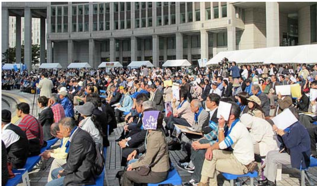
強い日差しの中、警察発表で800人が参加し熱心に失踪者家族の訴えに耳を傾けていた。

拉致被害者の会という「 家族会 」「 救う会 」がよく知られていますが、この 特定失踪者問題調査会 というのは、2003年1月に「 救う会 」から分離独立した組織です。その理由は、「 特定失踪者 」についての調査活動を優先し、政治運動色を弱めること、 失踪者が北朝鮮 による 拉致事件 とは無関係だった場合の混乱を避けるため、とされています。