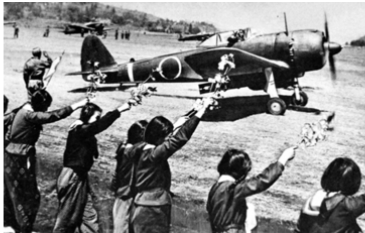
特攻機を桜を手に見送る女学生たち

私は、特攻隊員が凱旋して桜花に宿っていると思って、毎朝、わが家を出ると、桜の木に向かって最敬礼していると述べた。