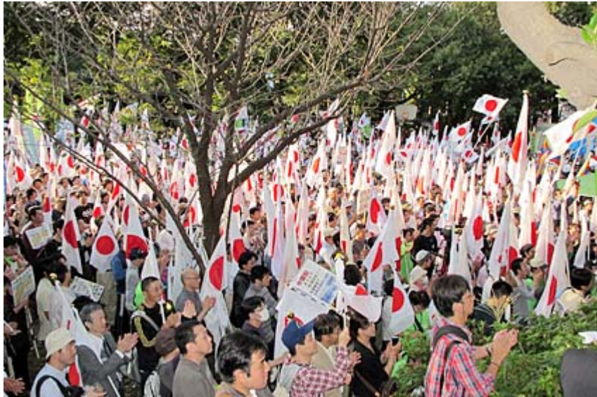
3500人が集まった10.16デモ行進の集会。日章旗が美しい。

民主党 は今年の総選挙に当たって、今の安逸な「国民生活が第一」だと、約束した。どうして、日本国民が日本の未来に希望を描くことが、できなくなったのだろうか。国を愛して、明日の日本を想う心が希薄になった。