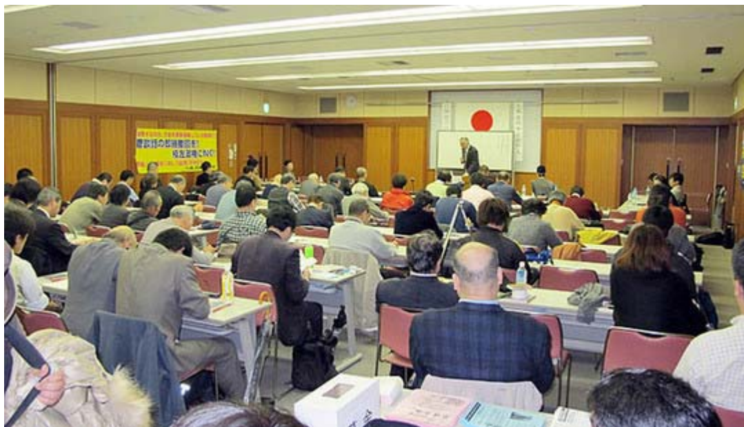
東京を台風直撃の時間というのにほぼ満席。良く集まってくれました。

台風直撃というニュースが前日から流される中、参加された皆さまご苦勞様でした。さすがに今回は条件が悪すぎると思っていれば、結局は会場はほぼ満杯、氏の人気の程が伺われました。昨年の「やるんじゃなかった日韓併合！」に続く独演会の第二弾でしたが、今回は普段ほとんど取り上げられることの少ない視点からの朝鮮人論でしたので大変勉強になりました。