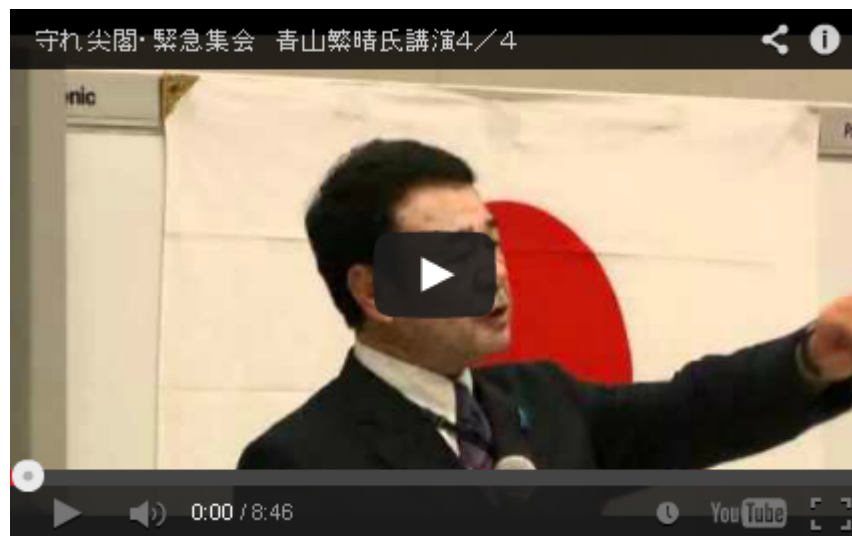
22.9.30 守れ尖閣諸島 緊急集会 青山繁晴氏講演 1 2 3 4

支持率は急落し、もはや政権が持たないのは誰の目にも明らかです。良識ある日本の政治家なら、自ら「内閣総辞職」を選択すべきですが、日本人より特アの外国人が大事という現政権は、再び外国人参政権は 最高裁 の傍論重視という暴論を言い始めた。