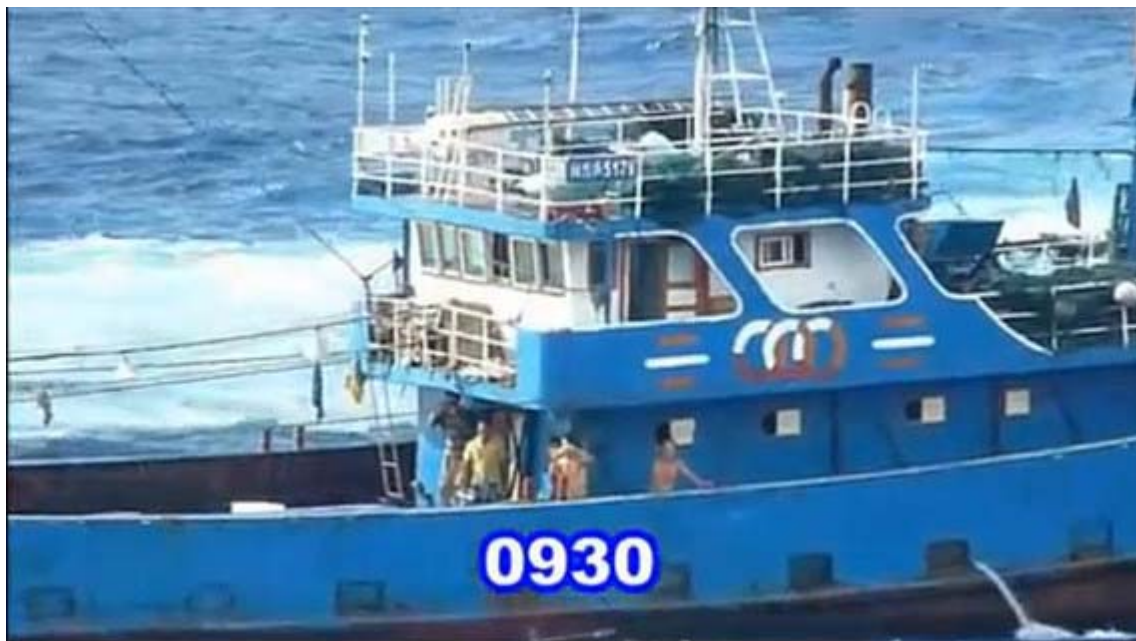
退去勧告にも動じない落ち着いた漁船の船員たち

また、ビデオ流出についての管理体制については確かに問題はあるが、今回の件についてはむしろ肯定的に評価したいなどと語った。