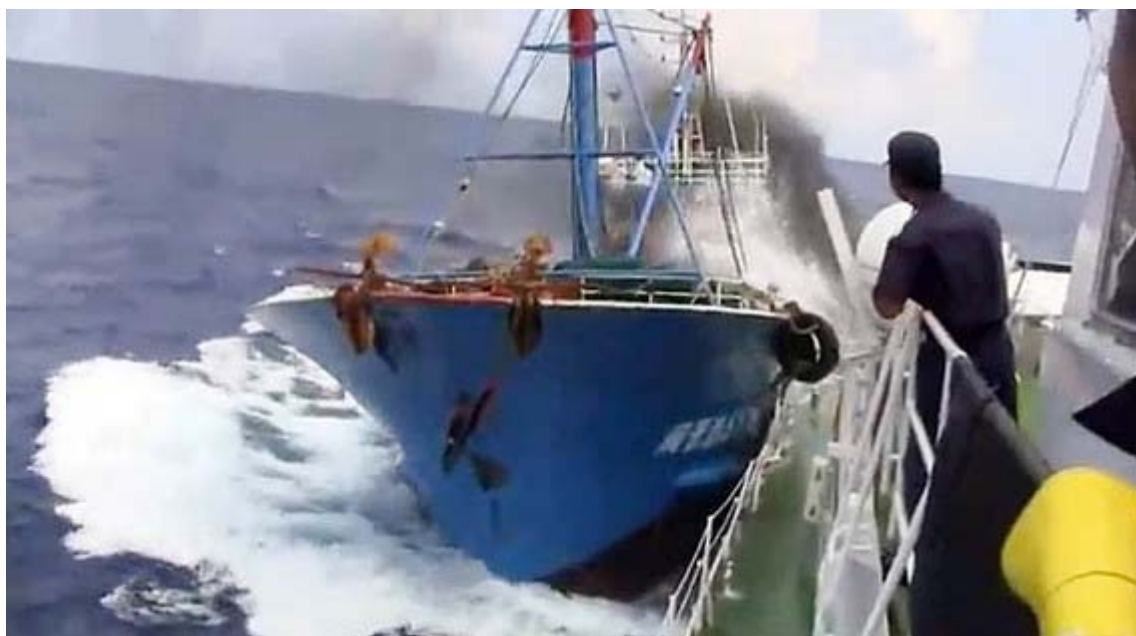
支那漁船が巡視艇にぶつかった瞬間の画像

正午のNHKニュースは午前中に明らかになった反応や政府の対応も含めて15分と時間を延長してさらに詳報した。