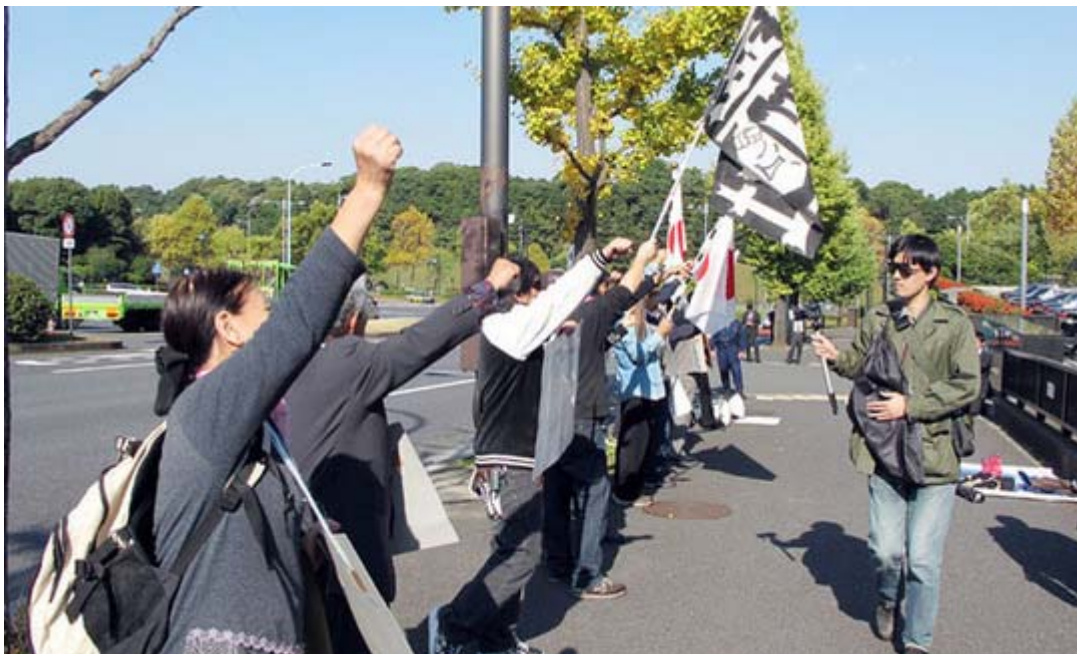
国土交通省の建物に向かってシュプレヒコールをあげる街宣参加者

以下の呼びかけに私が気がついたのは実は当日の早朝でした。一時間くらいなら何とかなるか、と出かけて撮影したのがこの写真です。