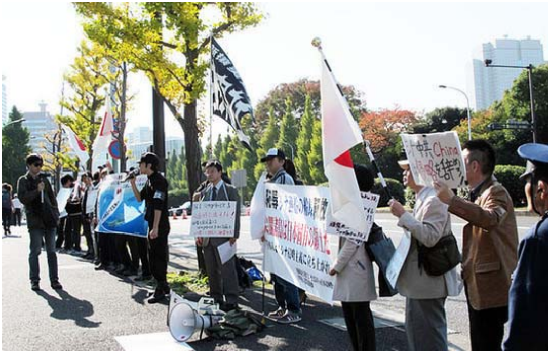
国土交通省前での緊急街宣のスナップ

一昨日の国会中継で自民党の棚橋泰文議員が菅首相に「胡錦濤主席とAPECで会談したら尖閣諸島は日本固有の領土だと主張するんですね」と繰り返し質問してました。すると、菅首相は「その通りです」とはわずに歯切れの悪い答弁を繰り返してましたので、また弱腰外交をするつもりだな、と見ていました。