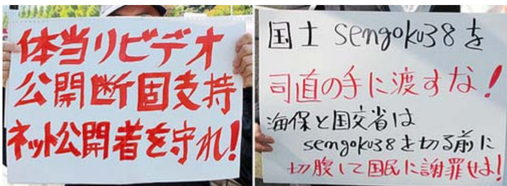
このプラカードには共感します。

国交省 と海保は「sengoku38」を切るよりも、己の腹を切って「sengoku38」を司直の手に委ねようとした恥知らずを国民に謝罪せよ。