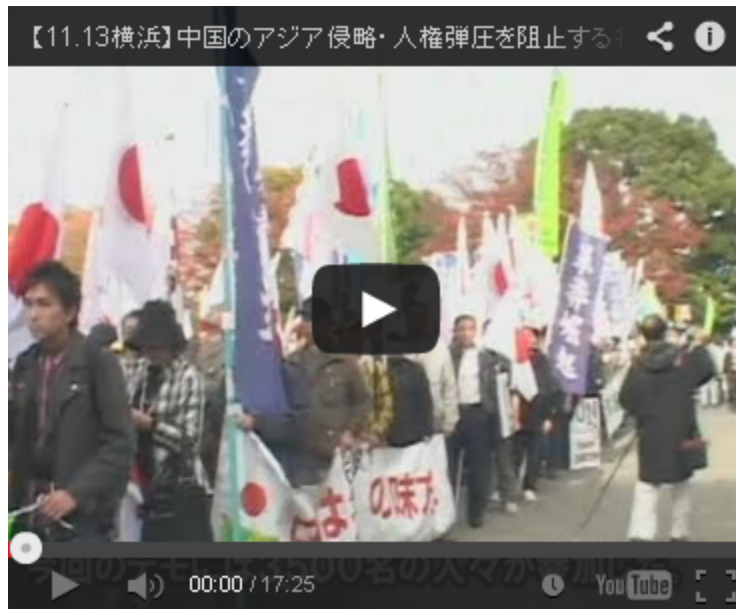
こちらはデモ行進の動画です。