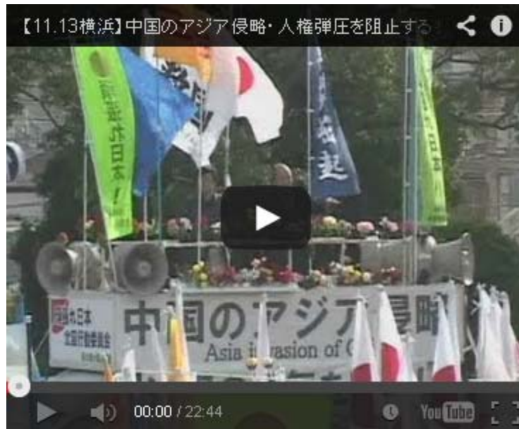
11.13横浜集会&デモ、チャンネル桜の動画です。