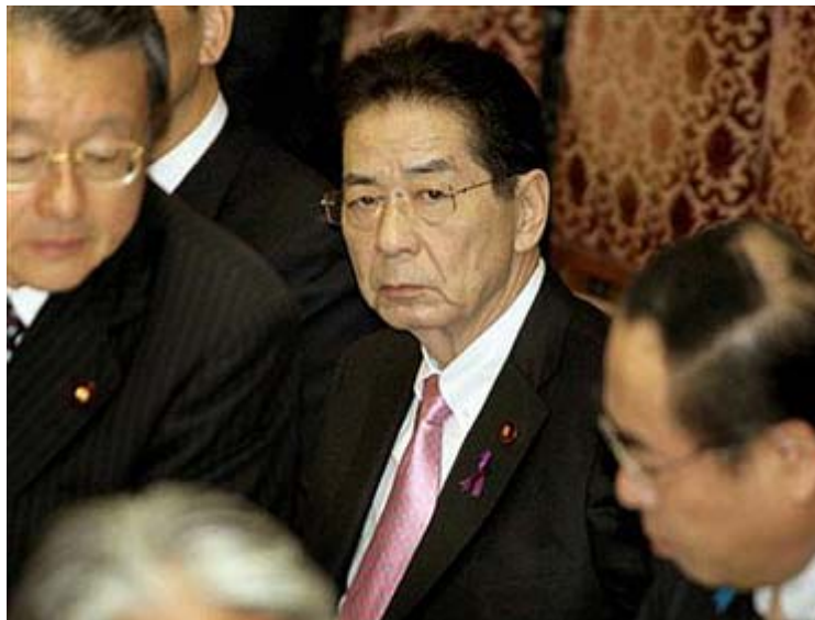
衆院予算委員会で委員長、理事が話し込む後ろでカメラを覗みつける仙谷由人官房長官＝15日午後国会・衆院第一委員室

私は、今回の行動が正しいと信じておりますが、反面、公務員のルールとしては許されないことだったと反省もしております。私の心情をご理解いただければ幸いです」