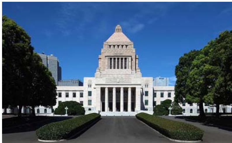
「日本」の国会議事堂。