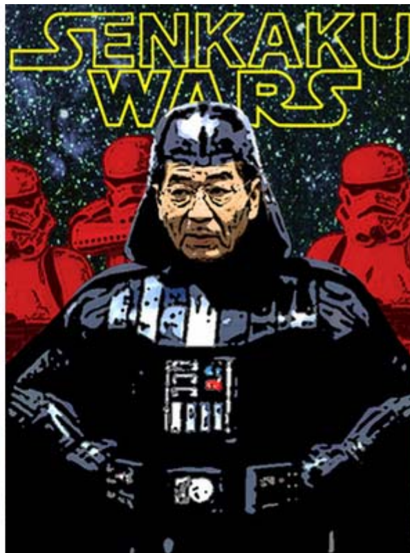
このポスターはyohkan さんからお借りしました。