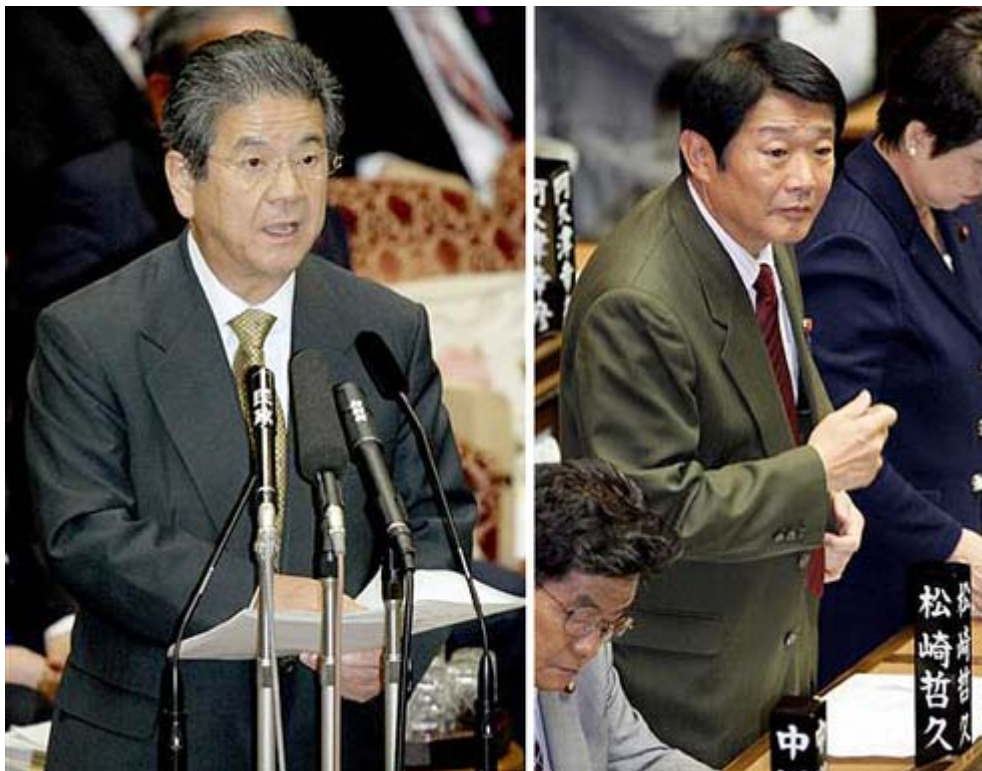
言論弾圧に踏み切って過ちを認めない北澤防衛大臣と 自衛隊を恫喝したと報道された松崎議員