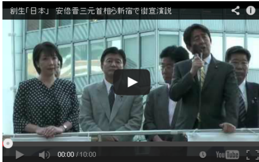
早く創生日本が 自民党 の主導権をにぎって欲しいのですが。