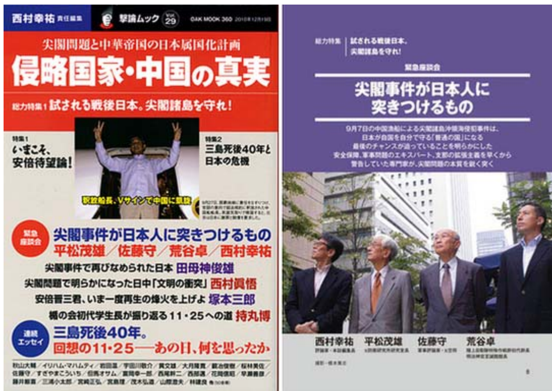
撃論ムック、詳しい内容は画像をクリックでHP目次ページで。

また、この特集では西村慎吾氏、田母神俊雄氏ら18人の執筆陣が気合いの入った論文を寄稿しており、読み応え充分。加えて特集1として、嬉しいことに「いまこそ安倍待望論」、特集2では「三島死後40年と日本の危機」といういずれもタイムリーな記事が満載されています。価格は税込1200円、 オークラ出版 から全国の書店で好評発売中です。